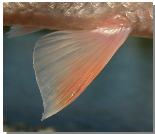
Bagre. Detalle de la aleta pélvica