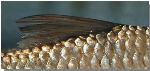
Bagre. Detalle de la aleta dorsal