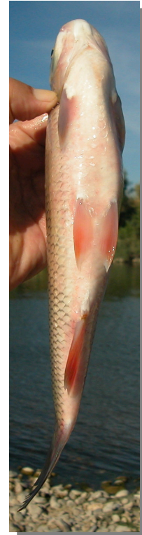
Bagre. Detalle del dorso y vientre