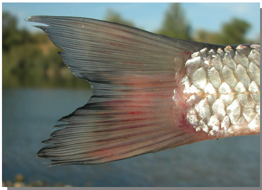
Bagre. Detalle de la aleta caudal