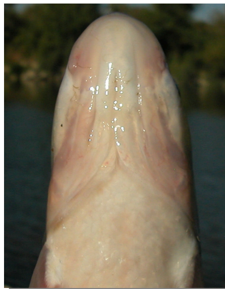
Bagre. Detalle de la cabeza