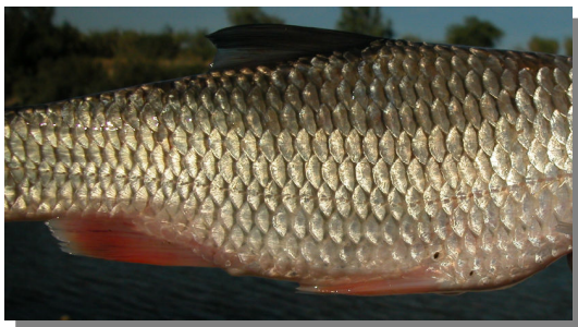
Bagre. Detalle de las escamas del flanco