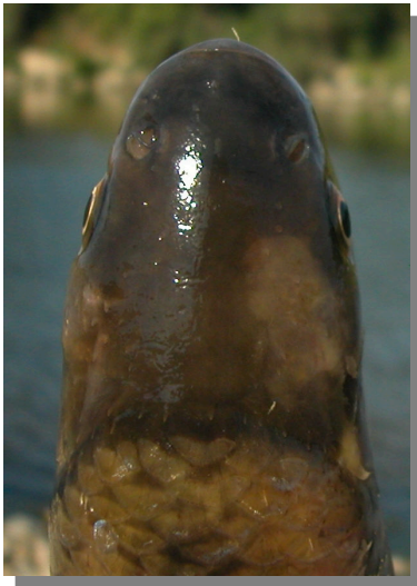
Bagre. Detalle de la cabeza