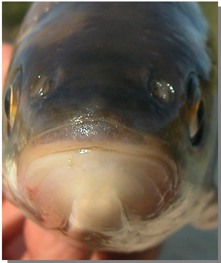
Bagre. Detalle de la boca