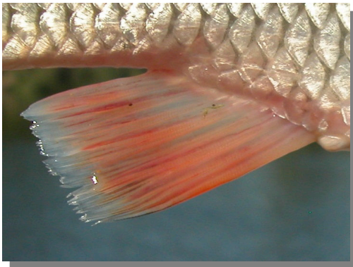
Bagre. Detalle de la aleta anal