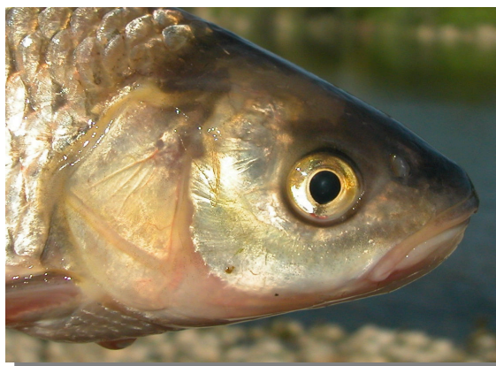
Bagre. Detalle de la cabeza