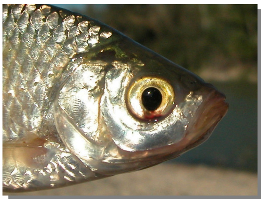
Escardino. Detalle de la cabeza