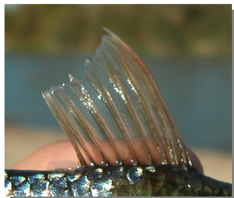
Escardino. Detalle de la aleta dorsal