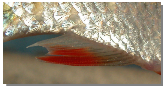
Escardino. Detalle de la aleta anal