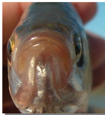
Escardino. Detalle de la boca