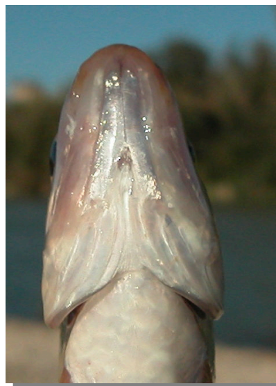
Escardino. Detalle de la cabeza