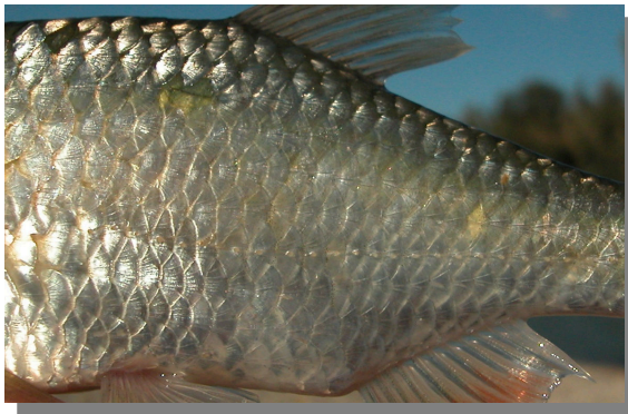
Escardino. Detalle de las escamas del flanco