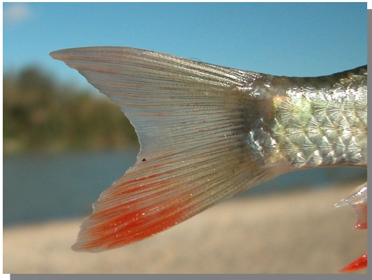
Escaradino. Detalle de la aleta caudal