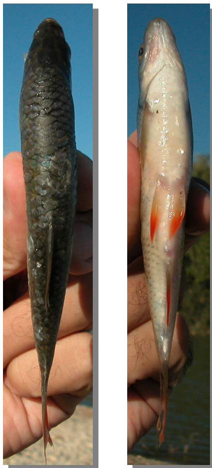
Escardino. Detalle del dorso y vientre