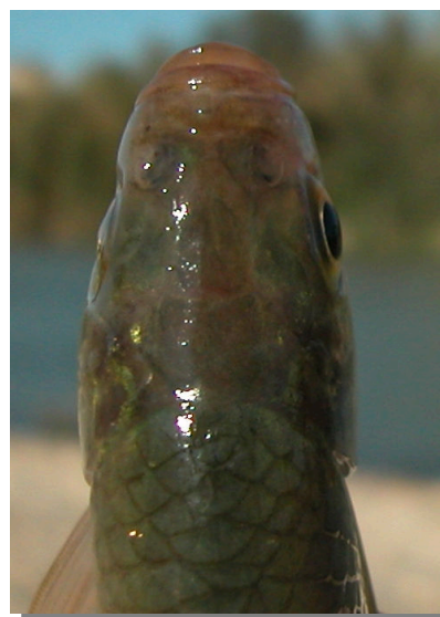
Escardino. Detalle de la cabeza