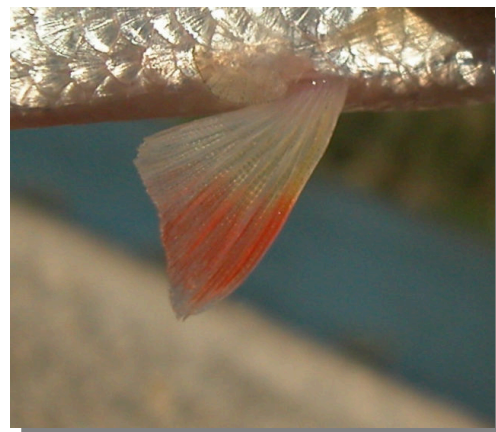
Escardino. Detalle de la aleta pélvica