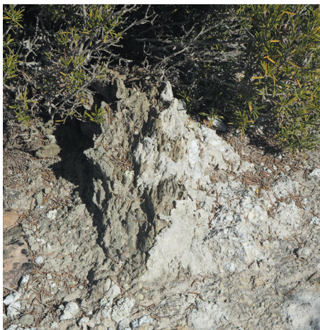
Base de mojón de yeso (nº 114 con Monegrillo)