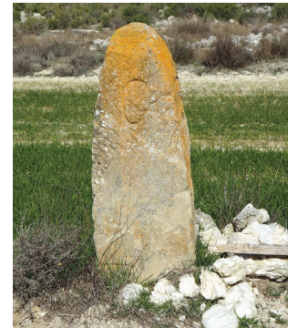
Mojón de arenisca (nº 1 con Sástago)

Arenisca: los mojones con este tipo de roca se encuentran únicamente en la linde con Sástago. Tal y como se menciona en el documento de deslinde se colocaron algunos como reposición en una mojonación realizada en el año 1858. No hay arenisca en el centro de la Depresión del Ebro por lo que este tipo de material debió de obtenerse al norte de los Monegros oscenses; en cualquier caso, los 163 años transcurridos desde su colocación no han hecho mella en estos mojones ya que los que se han conservado se encuentran en muy buen estado.