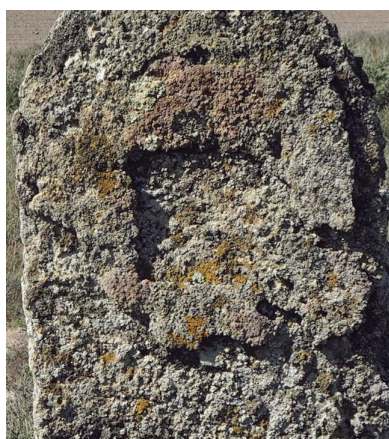
Mojón de yeso con encuadre para la letra B (nº 28 con Bujaraloz)