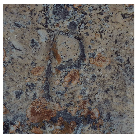
Mojón de caliza con la letra P simple (nº 3 con Castejón)