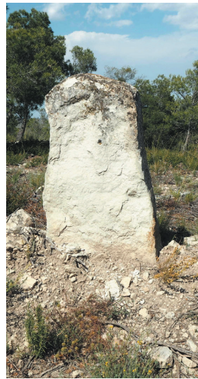
Mojón de caliza erosionado mediante lascas (nº 18 con Castejón de Monegros)