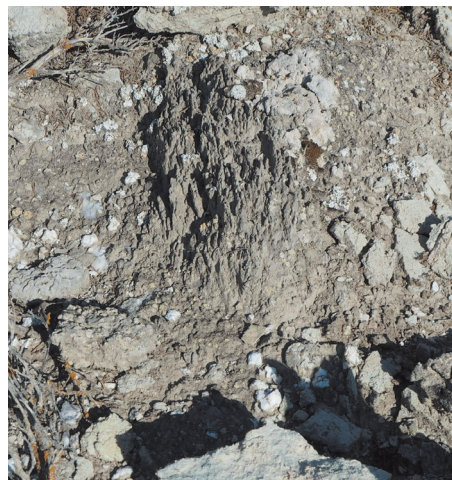
Base de mojón de yeso muy antiguo (nº 127 con Monegrillo)

En las mojonaciones antiguas los canteros señalaban la dirección del término con la letra inicial del nombre de cada pueblo grabada en el lado correspondiente del mojón (si los operarios no se equivocaban al colocarlo, tal y como ocurrió con el mojón nº 18 con Monegrillo), letra que a veces falta en algunos que se colocaron como reposiciones. Estas letras han aguantado más en los mojoneros hechos de piedra caliza debido a la mayor dureza de la roca, mientras han desaparecido por erosión en la mayor parte de los de yeso: es más, en estos fue perjudicial el marcar los términos con una letra ya que esa incisión retiene el agua facilitando el comienzo de la disolución del yeso (ver mojón nº 66 con Gelsa). Hay un cantero fácilmente reconocible por cincelar las letras dentro de un recuadro y que realizó varios mojoneros en caliza con el término de Castejón de Monegros (como los mojoneros 2 y 55 por ejemplo, marcando entonces las letras “CA” hacia Castejón), encontrándose también en yeso con esa hechura el mojón nº 28 con Bujaraloz.