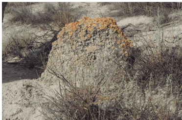
Mojón de mallacán ( nº 106 con Monegrillo)

Mallacán: el único mojón encontrado con este material es el nº 106 con Monegrillo. Es muy pequeño, de tan solo 29 cm de alto, colocado junto a otro hito de piedra de yeso de 1 m de altura que muestra poca erosión, por lo que parece que el pequeño debe pertenecer a una mojonación anterior. El mallacán es un material raro en el monte de Pina, aunque en el somontano de la Sierra de Alcubierre hay algunos afloramientos, uno de ellos explotado en el pasado para la fabricación de piedras de amolar.