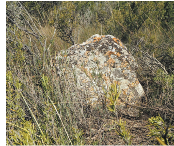
Mojón no trabajado por cantero (nº 38 con Monegrillo)

Se han encontrado 4 tipos de materiales para la realización de los mojones: