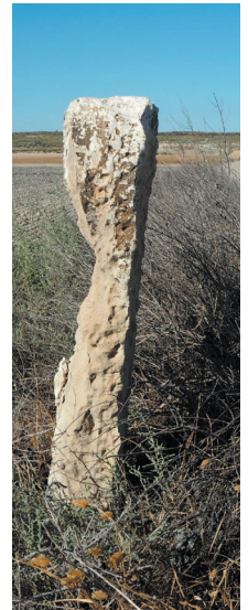
Mojón de caliza erosionado mediante lascas con punto de futuro colapso (nº 65 con Monegrillo)