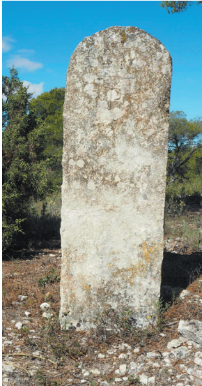
Mojón de caliza en buen estado (nº 12 con Monegrillo)