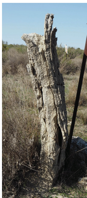
Mojón de yeso en proceso de disolución por la punta (nº 65 con Gelsa)