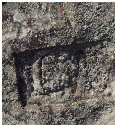
Mojón de caliza con las letras CA encuadradas (nº 2 con Castejón)