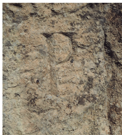
Mojón de caliza con la letra P simple (nº 20 con Monegrillo)