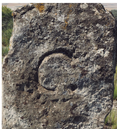
Mojón de caliza con la letra C simple (nº 8 con Castejón)