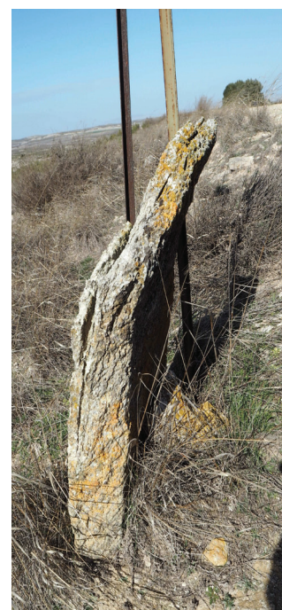
Mojón de yeso en proceso de colapso (nº 42 con Gelsa)