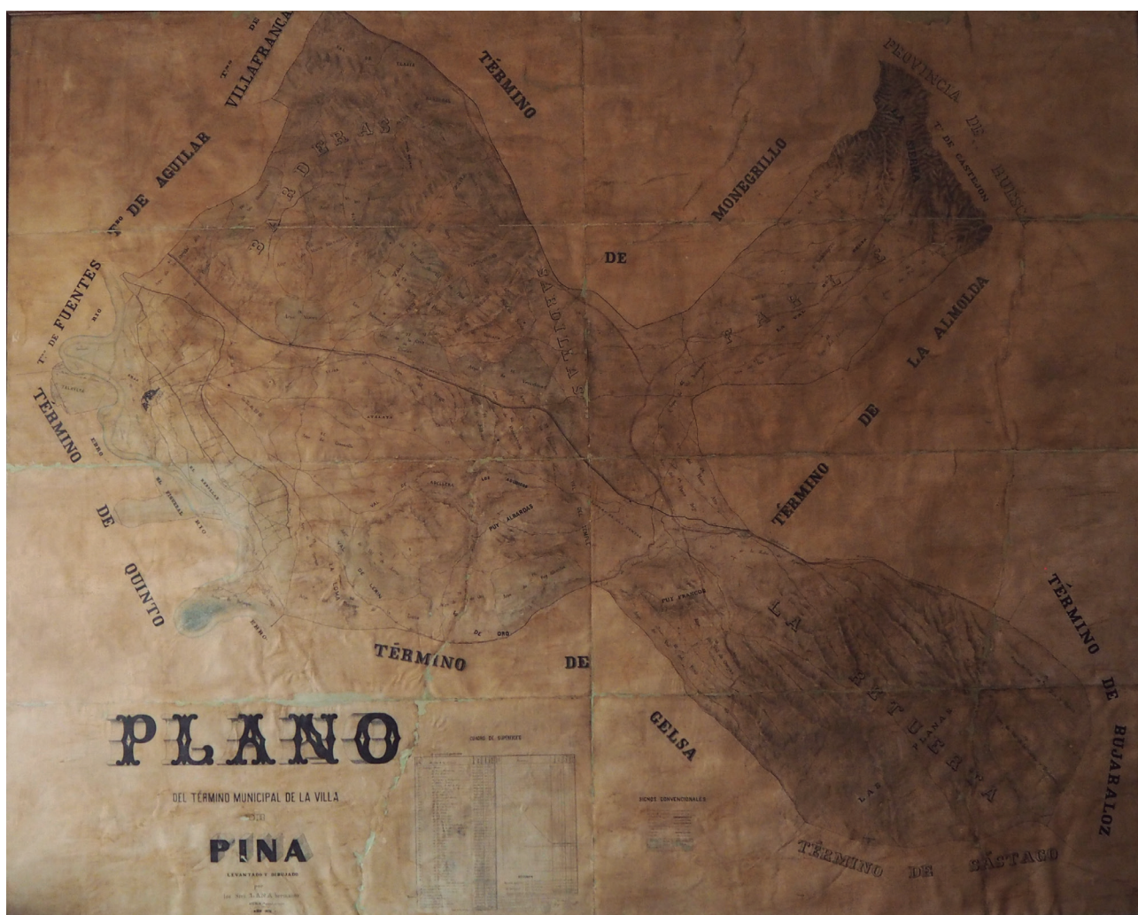
Plano mural del término municipal de Pina de Ebro pintado por los hermanos Lana en 1874. Está ubicado en el salón de plenos del antiguo Ayuntamiento sito en la Plaza de España.