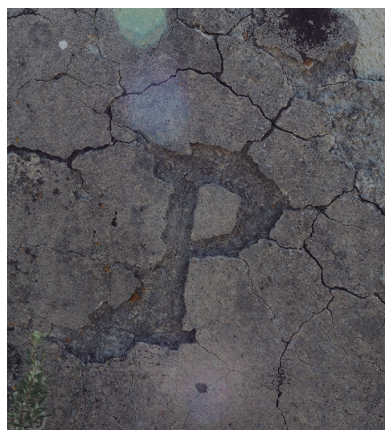
Mojón de yeso con la erosión agrandando la letra P (nº 66 con Gelsa)

Pero aún en las letras simplemente marcadas sin tanta sofisticación es posible advertir caligrafías diferentes indicando canteros distintos.