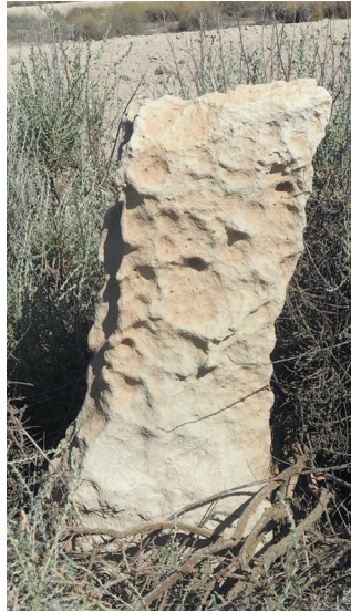
Mojón de caliza erosionado mediante tafoni (nº 62b con Monegrillo)