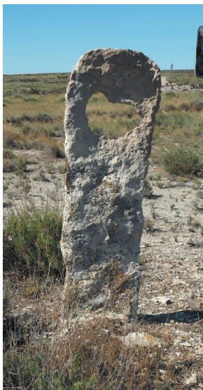
Mojón de caliza con erosión en la parte superior (nº 70 con Monegrillo)

Yeso: el yeso es la única roca posible fuera de los altos de la Sierra de Alcubierre y es por lo tanto el único material utilizado en las lindes alejadas de la Sierra como en Gelsa, en los mojones antiguos de Sástago, en Bujaraloz, Villafranca y Aguilar-Osera. Tiene la ventaja de ser mucho más fácil de trabajar que la caliza, pero el inconveniente de ser muy soluble y, por lo tanto, los mojones son más efímeros, efecto ampliado por la altura y delgadez con las que fueron realizados (ver mojón nº 109 con Monegrillo). Efectivamente, los hitos van desapareciendo por disolución del yeso, algunos empujándose mientras se mantienen en pie, como el nº 65 con Gelsa, y otros colapsando bien por adelgazamiento del yeso o por dilatación del mismo, como el nº 42 con Gelsa, para ir el pedazo caído fundiéndose con el suelo. El último resto de estos mojones es una base con la superficie acanalada por encima de la parte que está enterrada (ver mojones nº 114 y 127 con Monegrillo).