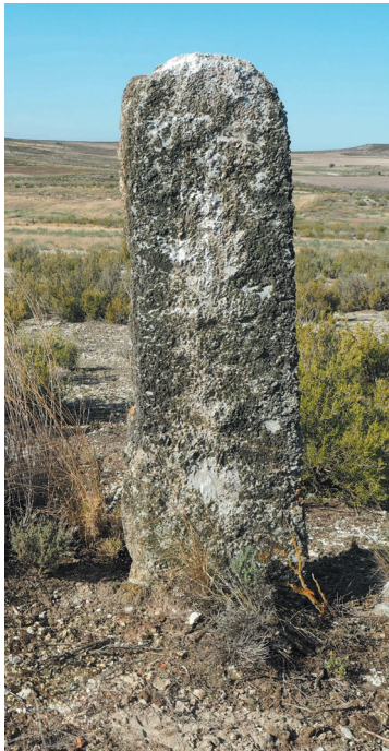
Mojón de yeso en buen estado (nº 109 con Monegrillo)