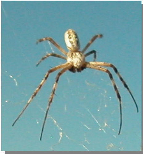
A. lobata . Macho: vista dorsal