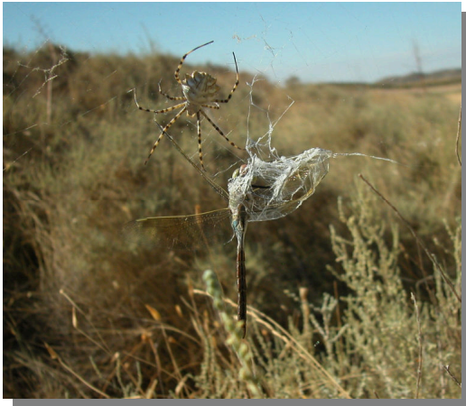
A. lobata . Hembra con presa ( Anax sp.)