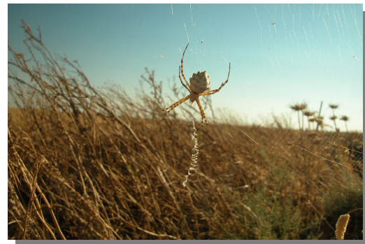
A. lobata . Hembra con tela