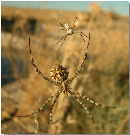
Valtravesera; Pina de Ebro (29/07/2016); arriba macho, abajo hembra