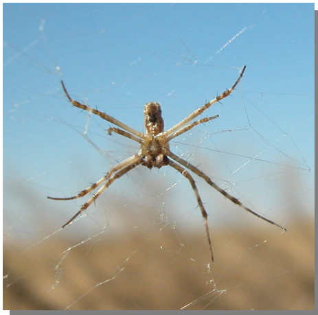
A. lobata . Macho: vista ventral