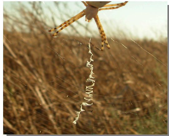
A. lobata . Diseño en zig-zag de la tela.