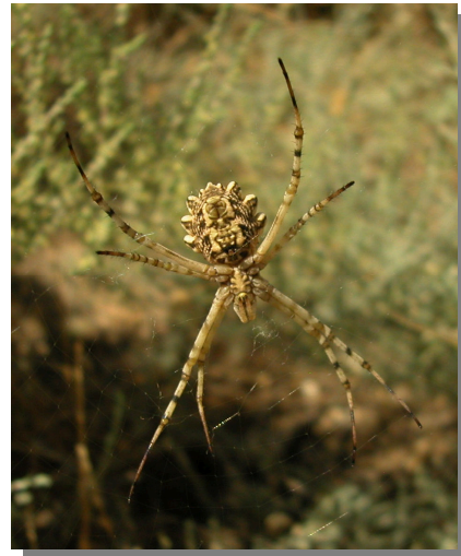
A. lobata . Hembra: vista ventral