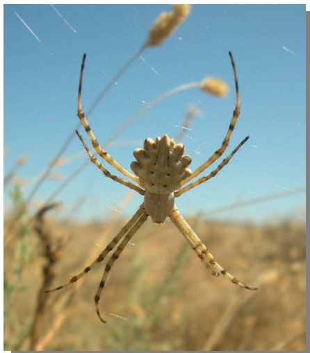
A. lobata . Hembra: vista dorsal