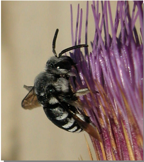
Agudicos; Pina de Ebro (27/06/2016)