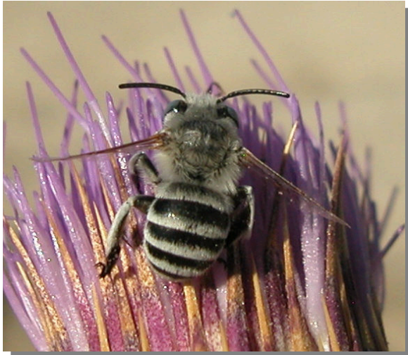
Agudicos; Pina de Ebro (27/06/2016). Macho