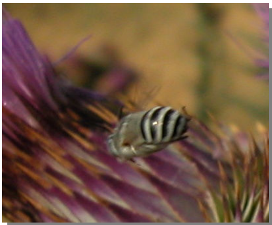
A. albigena . Macho