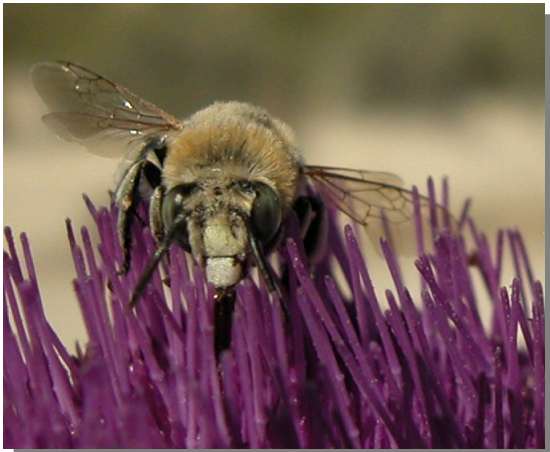
A. albigena . Hembra