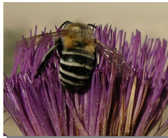
A. albigena . Hembra