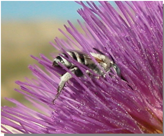
A. albigena . Macho