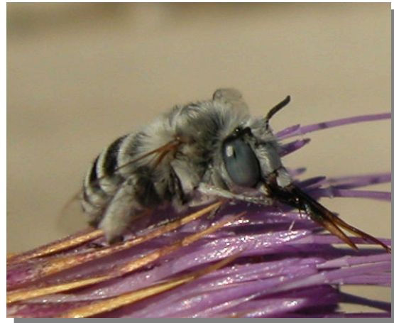
A. albigena . Macho