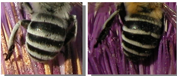
A. albigena . Determinación del sexo. Diseño del abdomen y metatarsos posteriores: izquierda macho, derecha hembra

Macho con pilosidad blanca en la cara exterior de los metatarsos posteriores, que ocupan prácticamente toda su longitud. Hembra con pilosidad blanca y corta en la zona discal del quinto tergito abdominal.