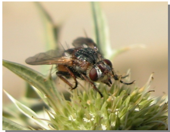
T. cfr. fera