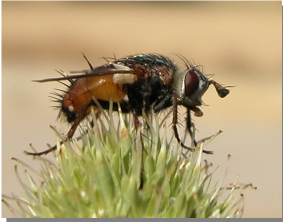
Farlé; Pina de Ebro (09/07/2016).