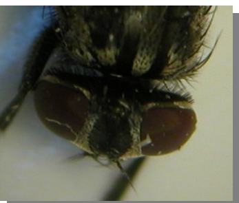
M. domestica . Determinación del sexo. Arriba macho; abajo hembra