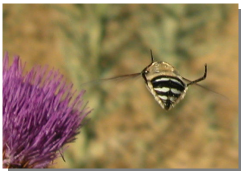
F. fasciata en Onopordum nervosum