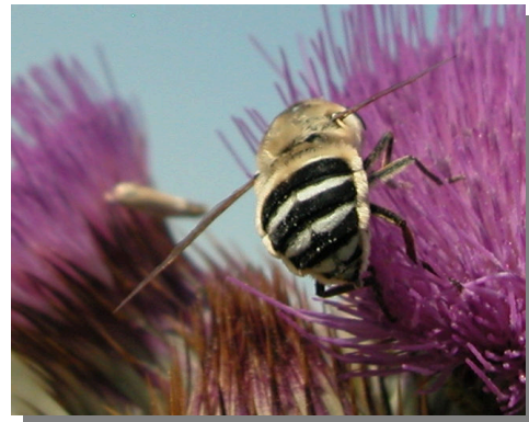
F. fasciata en Onopordum nervosum