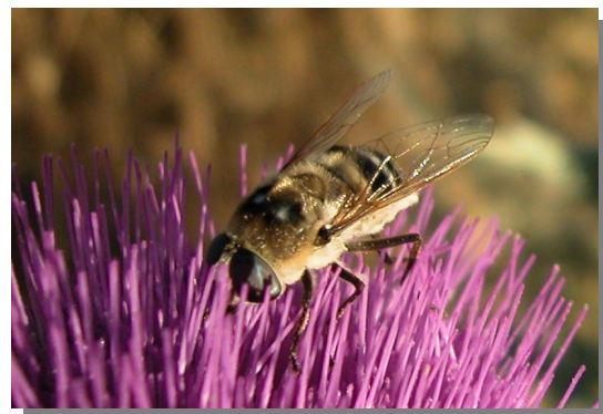
F. fasciata en Onopordum nervosum