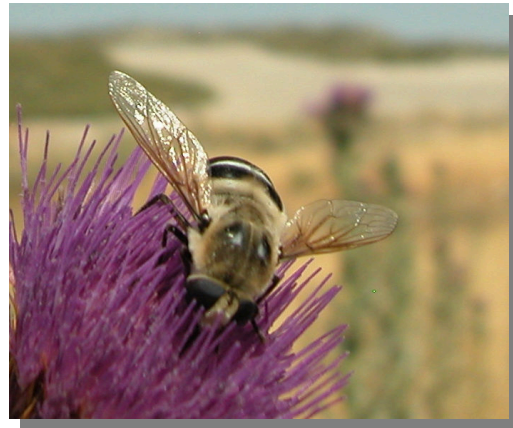
F. fasciata en Onopordum nervosum