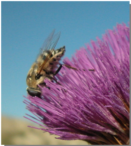
F. fasciata en Onopordum nervosum