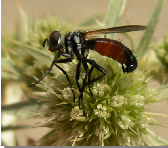
Vireta; Pina de Ebro (04/07/2016)