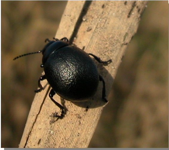
Timarcha sp. Hembra