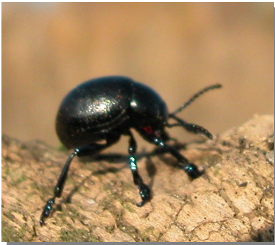
Timarcha sp. Macho