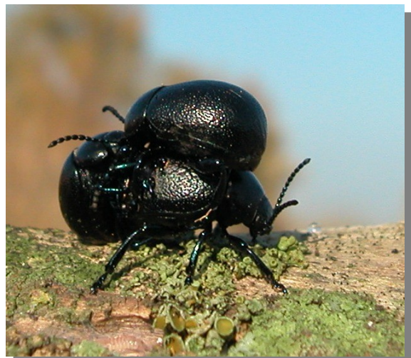
Timarcha sp. Cópula