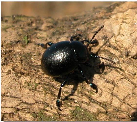
Timarcha sp. Macho