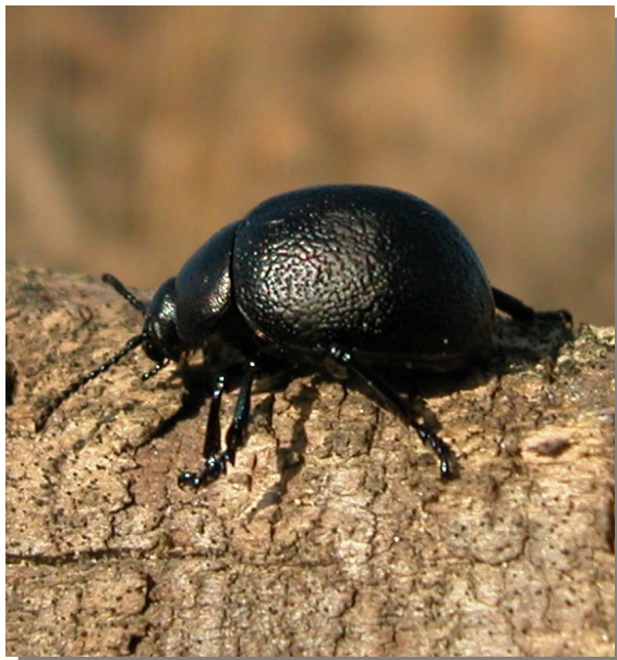
La Vega; Pina de Ebro (05/12/2016). Hembra