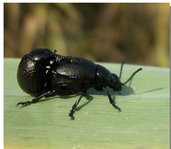
Timarcha sp. Cópula