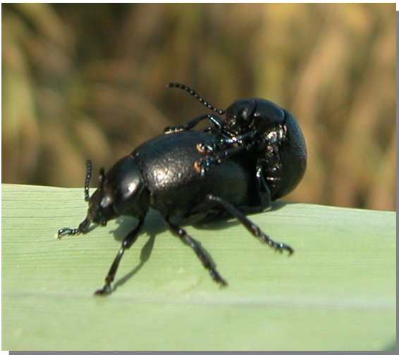
Timarcha sp. Cópula