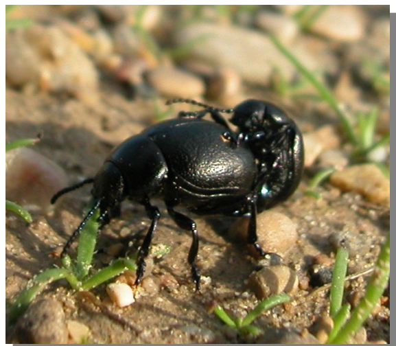
Timarcha sp. Cópula