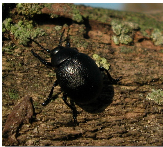
Timarcha sp. Hembra