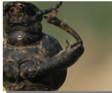
S. punctatus . Determinación del sexo. Diseño de las patas anteriores: arriba macho; abajo hembra