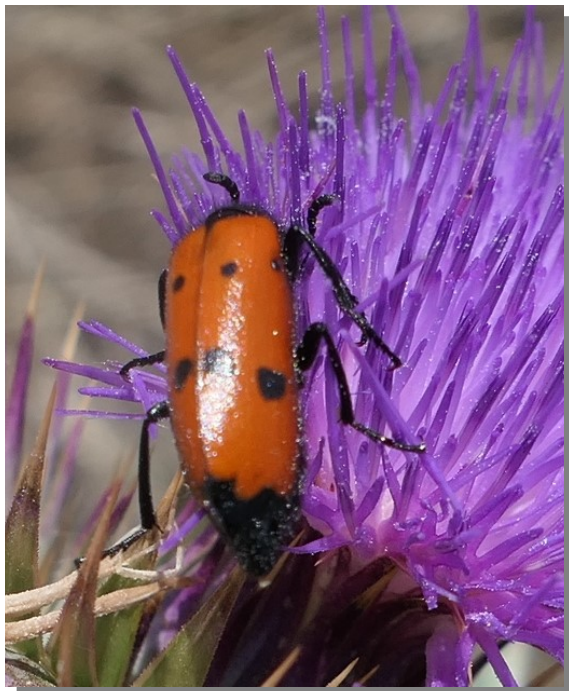
Val de Abellera; Pina de Ebro (23/06/2023)