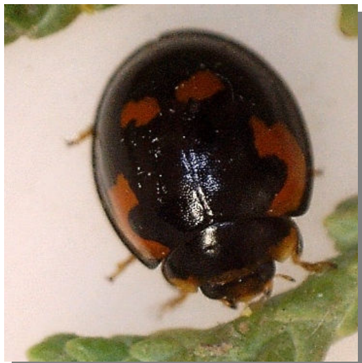
La Retuerta de Pina; Pina de Ebro (19/12/2016)