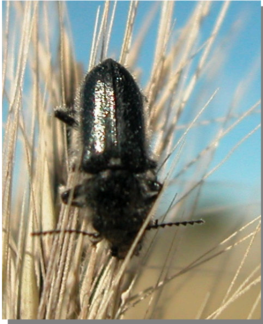
La Retuerta; Pina de Ebro (14/05/2017)