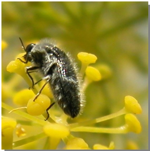
Vireta; Pina de Ebro (28/06/2016)