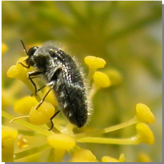
Vireta; Pina de Ebro (28/06/2016)