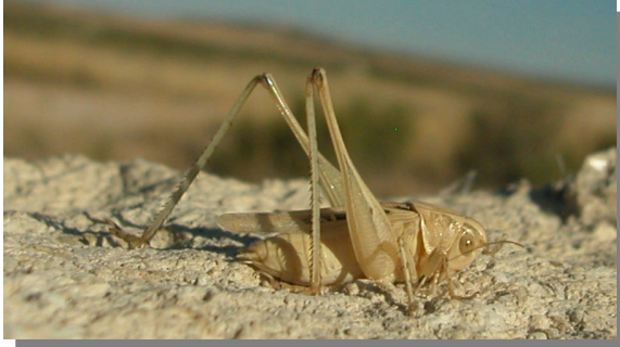
Valdebellera; Pina de Ebro (27/06/2016). Macho