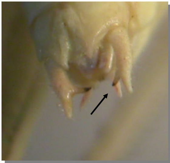
P. tessellata . Macho: cercos con diente interno situado más cerca del ápice que del centro

13-17 mm. Cercos del macho con un diente interno situado en el tercio apical; séptimo esternito de la hembra con una proyección, vista lateralmente, que acaba bruscamente en la parte terminal; ovopositor corto, curvado gradualmente desde la base al margen inferior y anguloso en el margen superior.