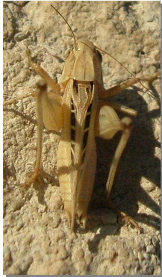
P. tessellata . Macho