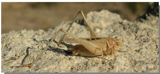
P. tessellata . Hembra