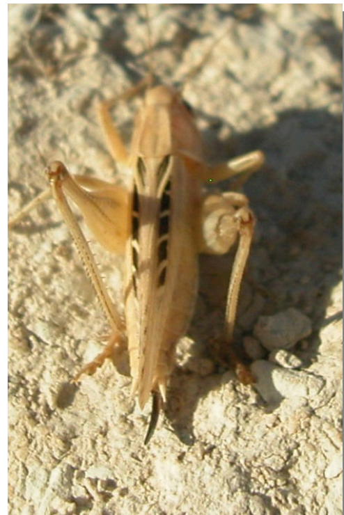
P. tessellata . Hembra