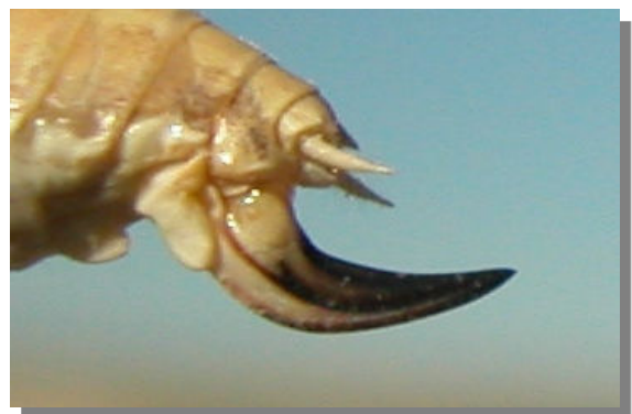
P. tessellata . Determinación del sexo. Presencia de ovopositor: arriba macho; abajo hembra con ovopositor corto y bruscamente curvado hacia arriba desde la base