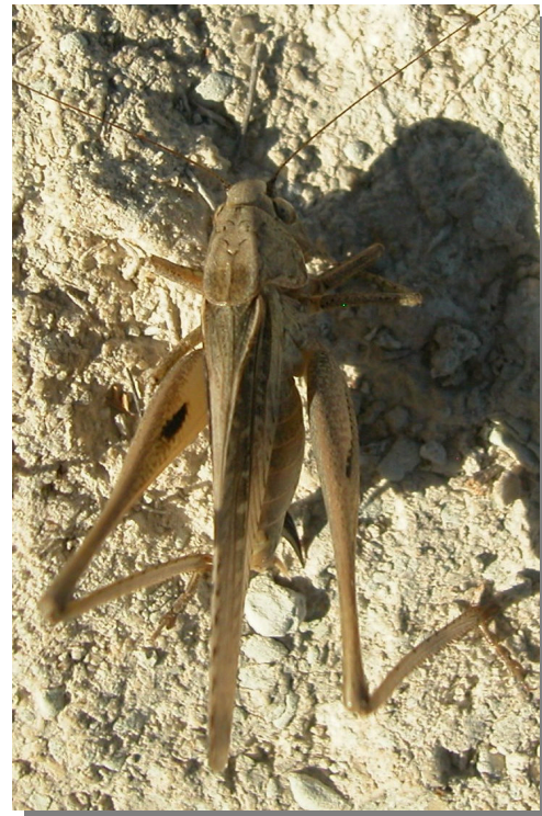
P. intermedia . Hembra