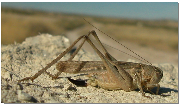
P. intermedia . Hembra