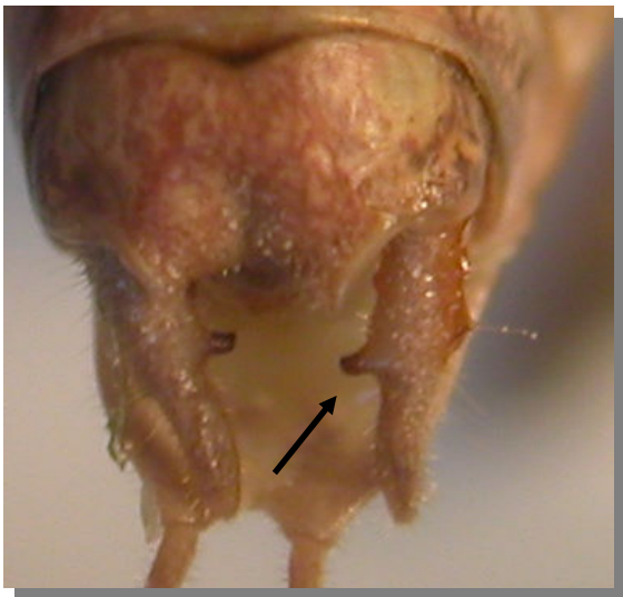
P. intermedia . Macho: cercos con diente interno central, cilíndricos desde la base y adelgazados después del diente.

Macho sin ovopositor. Hembra con ovopositor ligeramente curvado hacia abajo.