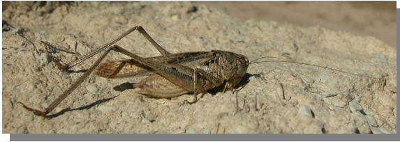
Valdeabellera; Pina de Ebro (20/06/2016). Macho