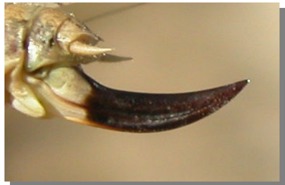
P. intermedia . Determinación del sexo. Presencia de ovopositor: arriba macho; abajo hembra con ovopositor curvado hacia arriba desde la base