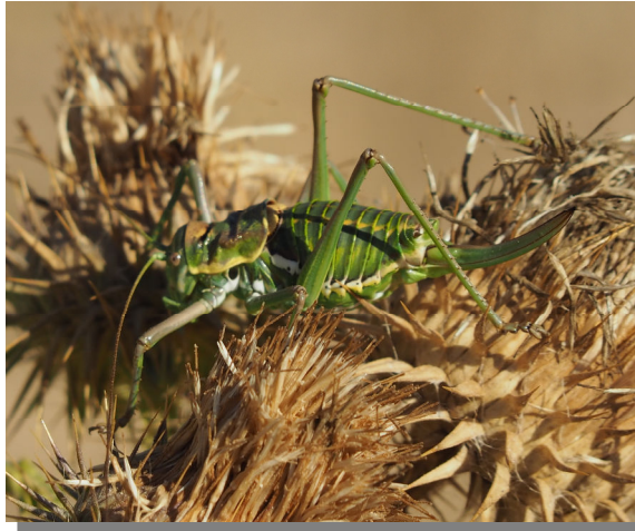
Valdeabellera; Pina de Ebro (19/06/2018). Hembra