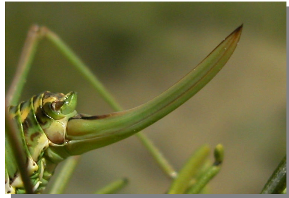
P. perezii . Determinación del sexo. Hembra: con ovopositor corto y curvado hacia arriba en el extremo