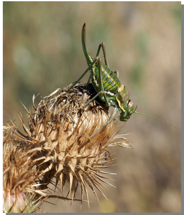
P. perezii . Hembra