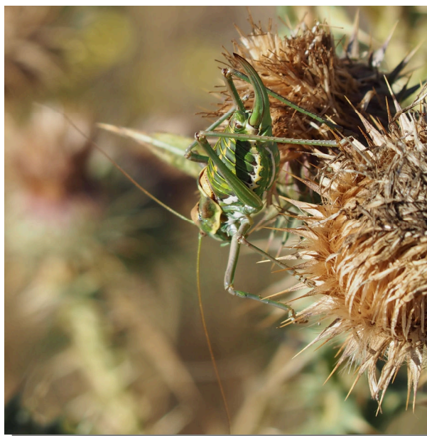
P. perezii . Hembra