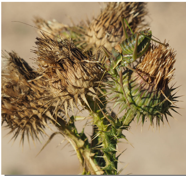
P. perezii . Macho