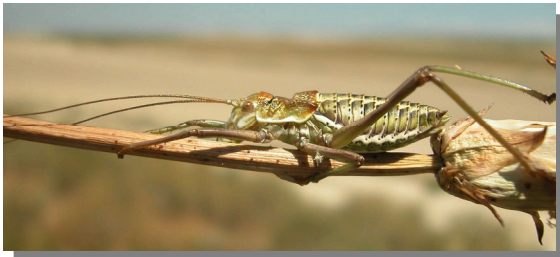
P. perezii . Ninfa