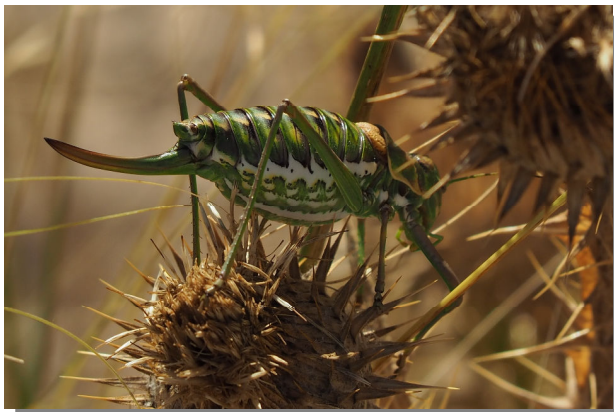
P. perezii . Hembra