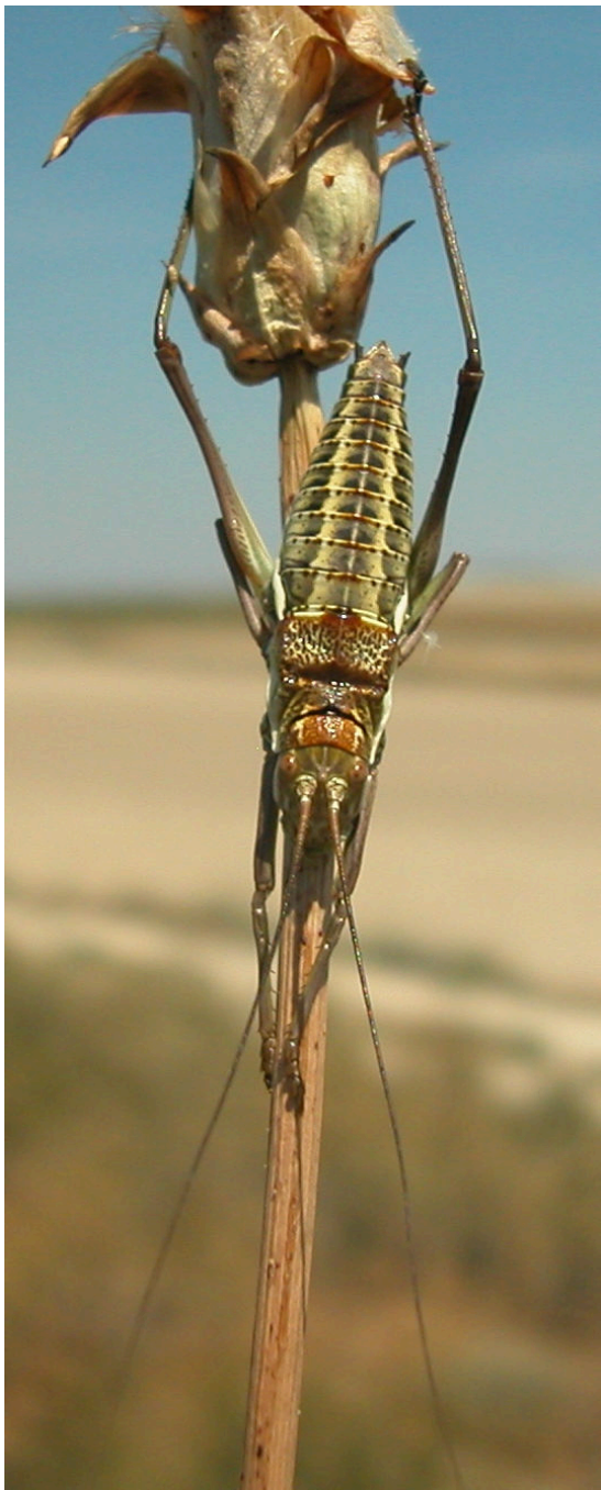
P. perezii . Ninfa