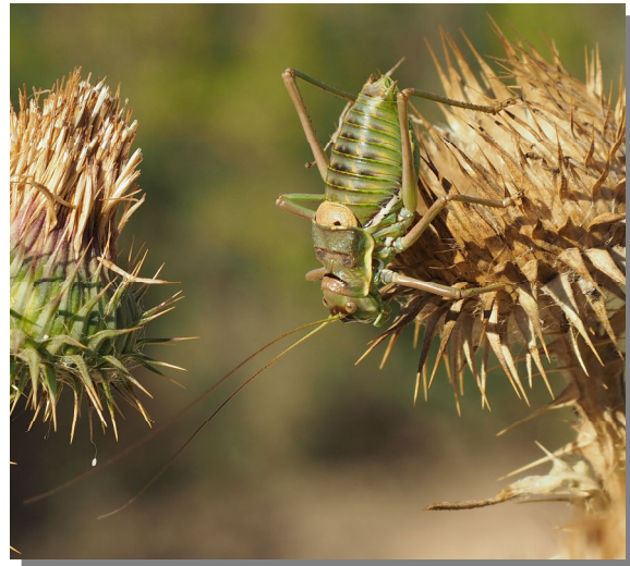
P. perezii . Macho