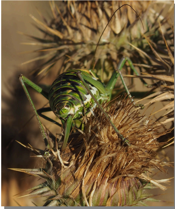
P. perezii . Hembra