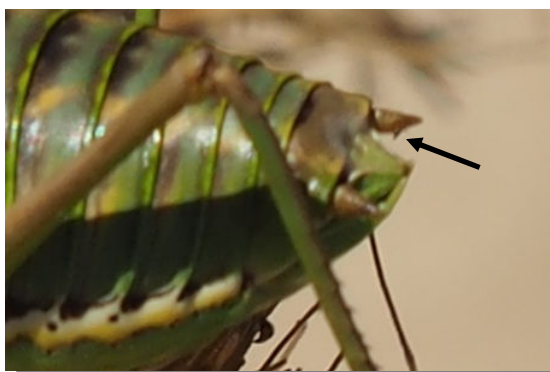
P. perezii . Determinación del sexo. Macho: sin ovopositor y cercos cónicos con un diente interior en el medio

Macho sin ovopositor. Hembra con ovopositor ligeramente curvado hacia arriba.