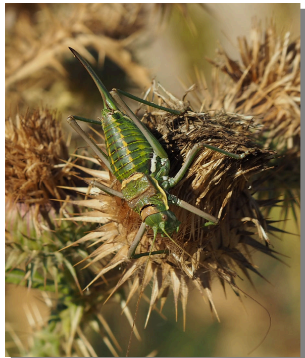
P. perezii . Hembra