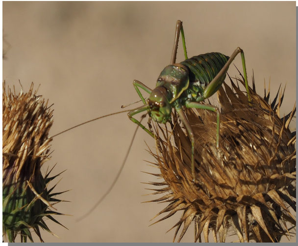
P. perezii . Macho