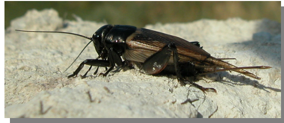
G. bimaculatus . Hembra