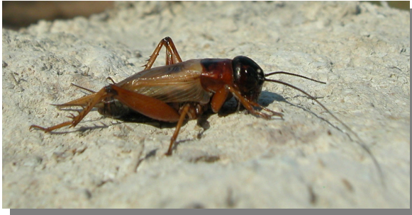
Talavera; Pina de Ebro (04//08/2016). Macho