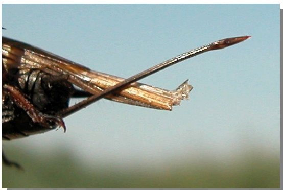
G. bimaculatus . Determinación del sexo. Presencia de ovopositor: arriba macho; abajo hembra