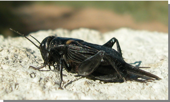
G. bimaculatus . Macho