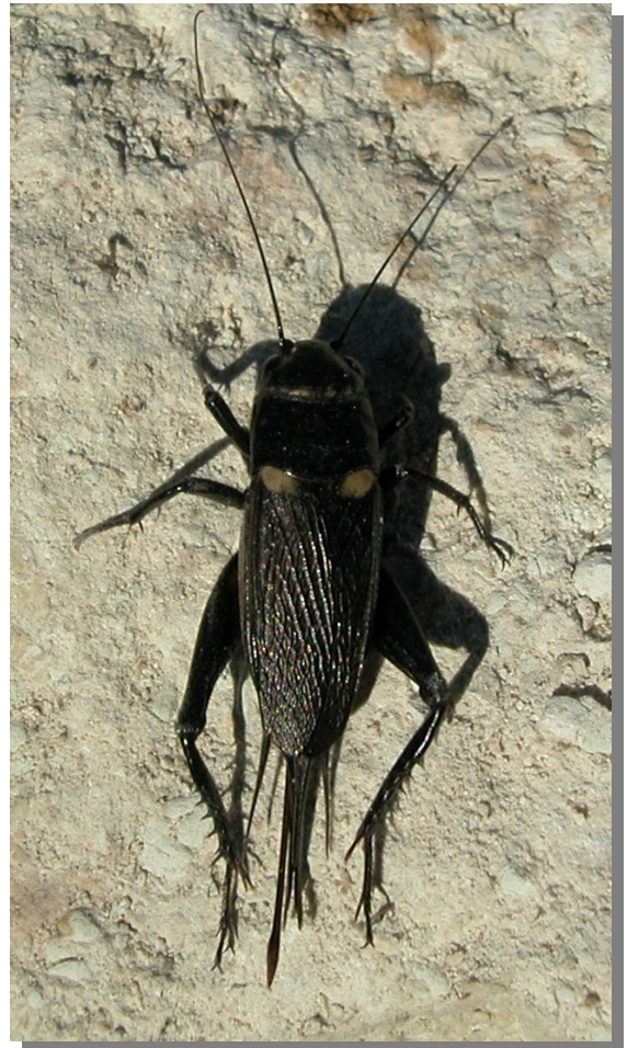
G. bimaculatus . Hembra