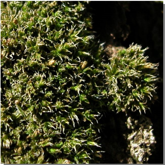
O. diaphanum en tronco de sabina albar ( Juniperus thurifera )