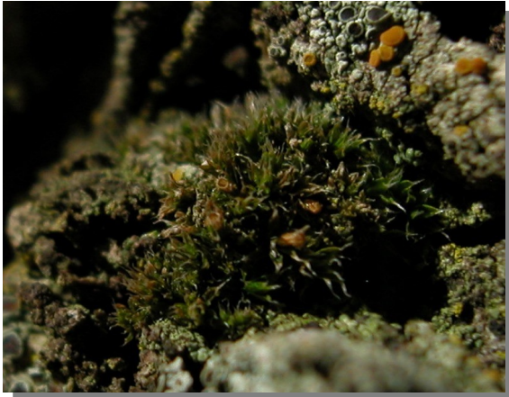
O. diaphanum en tronco de sabina albar ( Juniperus thurifera )