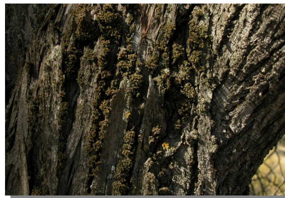
O. diaphanum en tronco de sabina albar ( Juniperus thurifera )