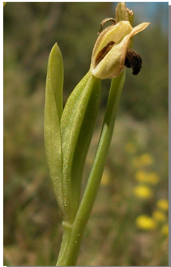
O. lupercalis . Detalle de cápsula inmadura