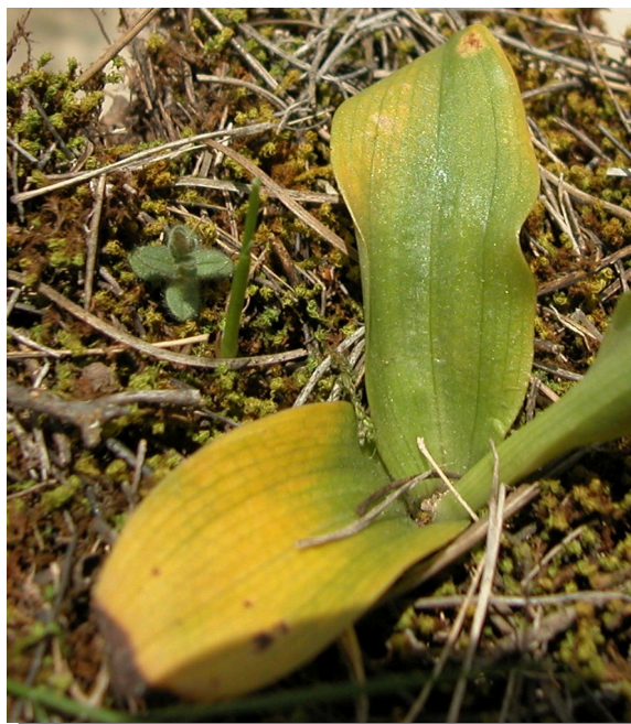
O. lupercalis . Detalle de hojas inferiores