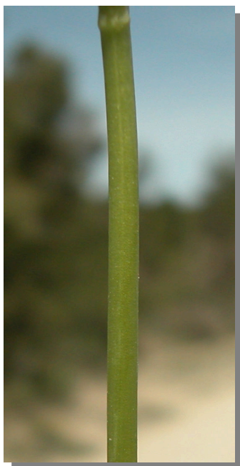
O. lupercalis . Detalle del tallo