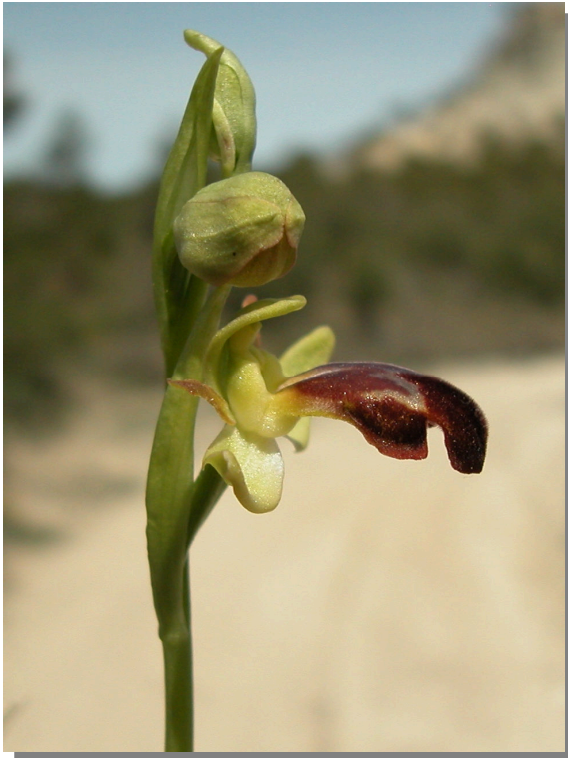
O. lupercalis . Detalle de la inflorescencia