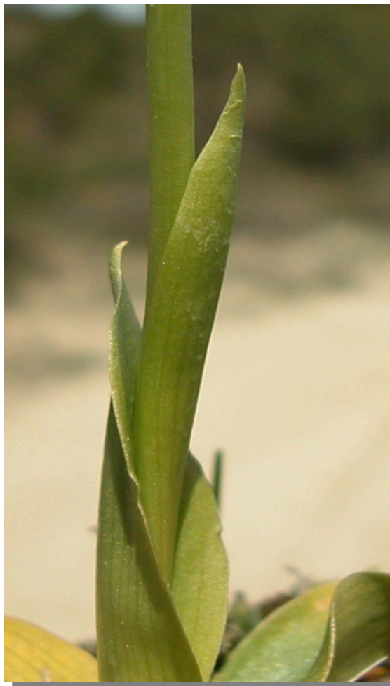
O. lupercalis . Detalle de hojas superiores