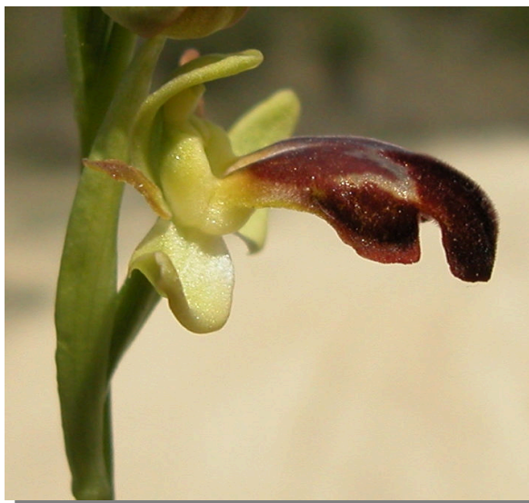
O. lupercalis . Detalle de la flor