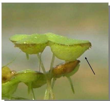
L. gibba. Vista lateral del fronde.

2-6 mm. Planta flotante; frondes orbiculares o abovados, gibosos en la parte inferior, a veces rojizos en los bordes; raíces de hasta 9 cm; inflorescencia de 0,8-1 mm.