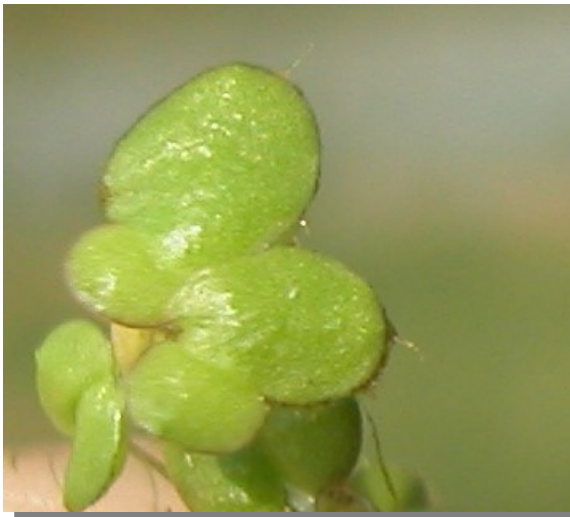
L. gibba . Vista superior del fronde.