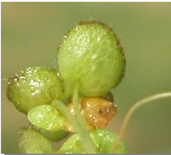
L. gibba . Vista inferior del fronde.