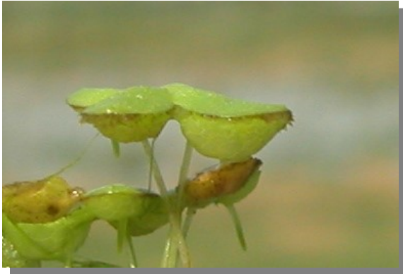
L. gibba . Vista lateral del fronde.