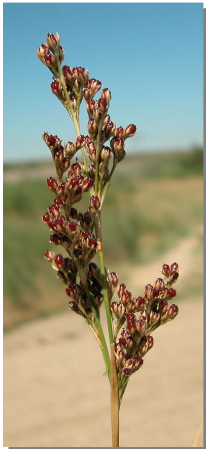
J. subulatus . Detalle de la inflorescencia