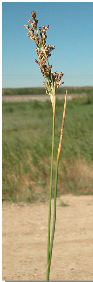
J. subulatus : detalle de la inflorescencia, tallo y hoja

Inflorescencia no superada por 2-4 brácteas foliáceas.