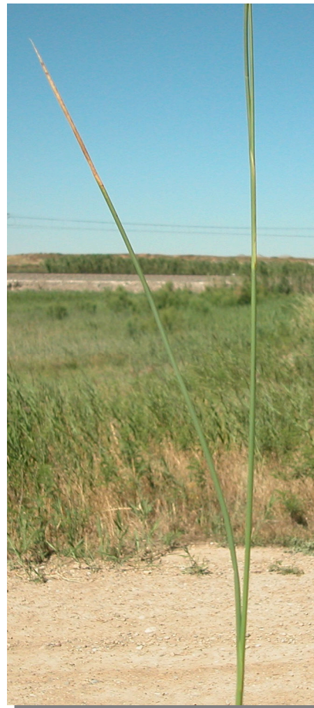
J. subulatus . Detalle de la hoja