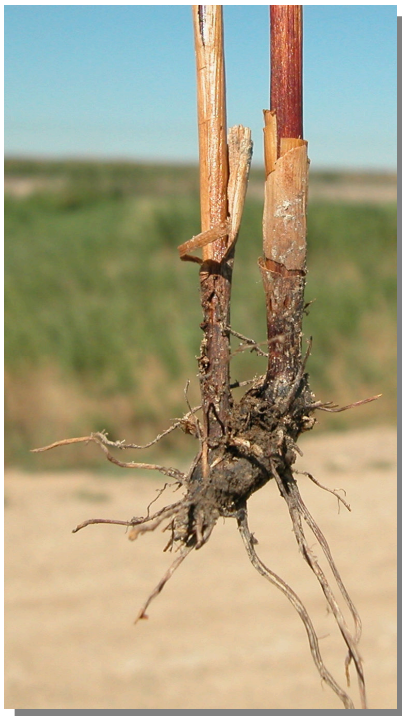
J. subulatus . Detalle del rizoma