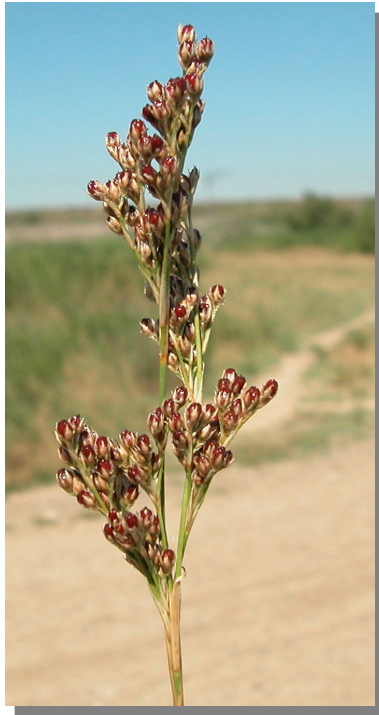
J. subulatus . Detalle de la inflorescencia