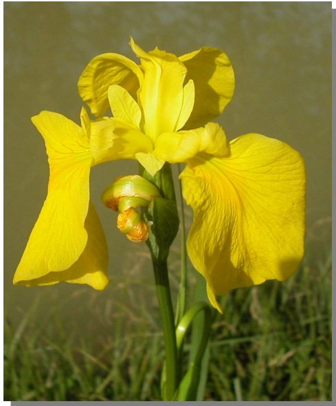
I. pseudacorus . Detalle de la flor