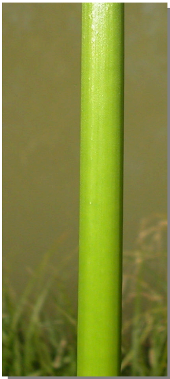
I. pseudacorus . Detalle del tallo