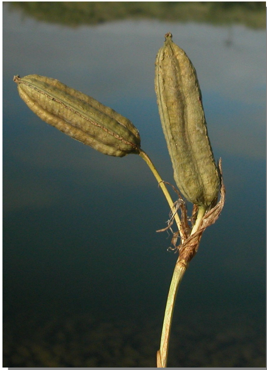
I. pseudacorus . Detalle de cápsula inmadura