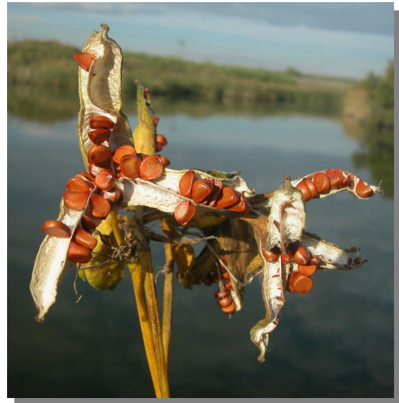
I. spuria . Detalle de cápsula madura