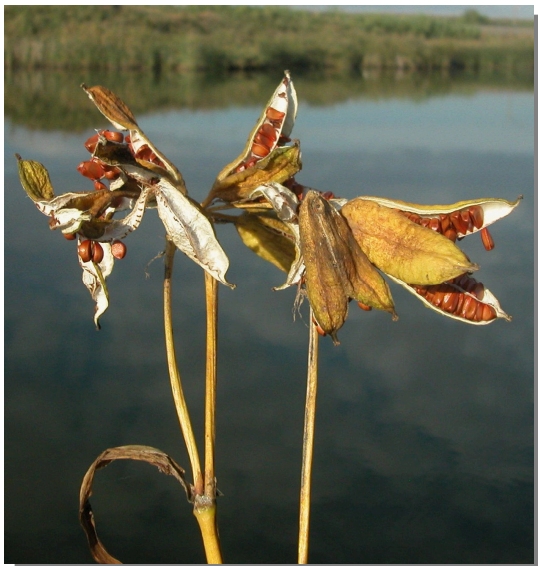
I. pseudacorus . Detalle de cápsula madura