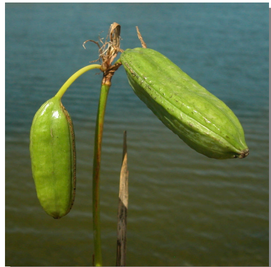
I. pseudacorus . Detalle de cápsula juvenil