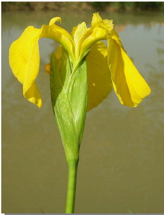
I. pseudacorus . Detalle de la flor