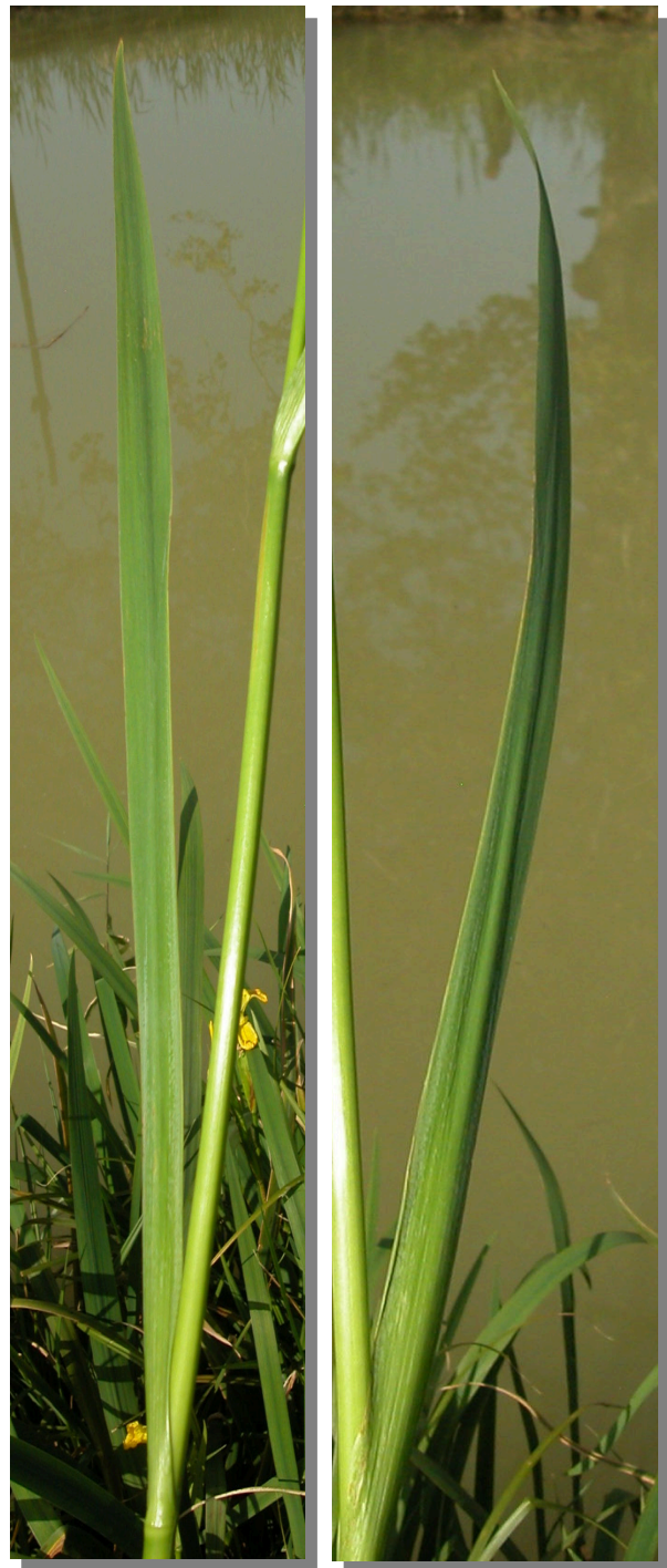
I. pseudacorus . Detalle de la hoja: haz y envés