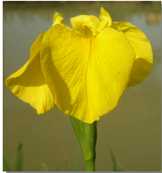
I. pseudacorus . Detalle de la flor