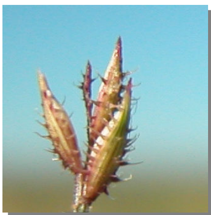
T. racemosus . Detalle de las espiguillas