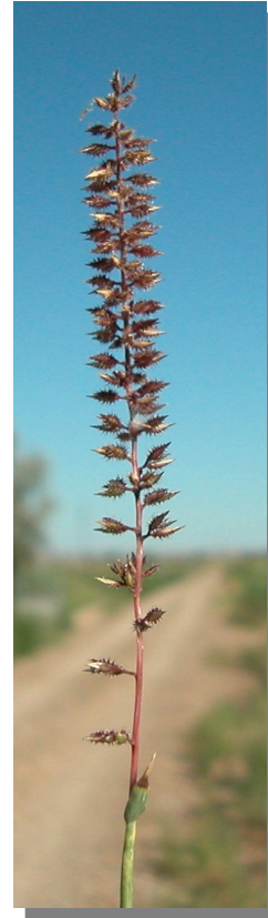
T. racemosus . Detalle de inflorescencia ma- dura