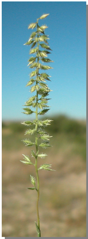
T. racemosus . Detalle de inflorescencia ju- venil