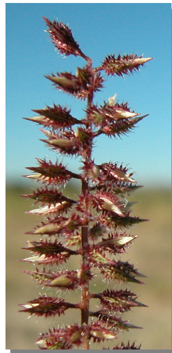
T. racemosus . Detalle de las espiguillas