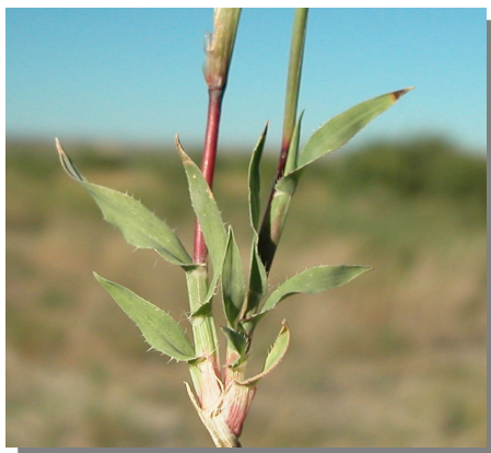
T. racemosus . Detalle de las hojas basales