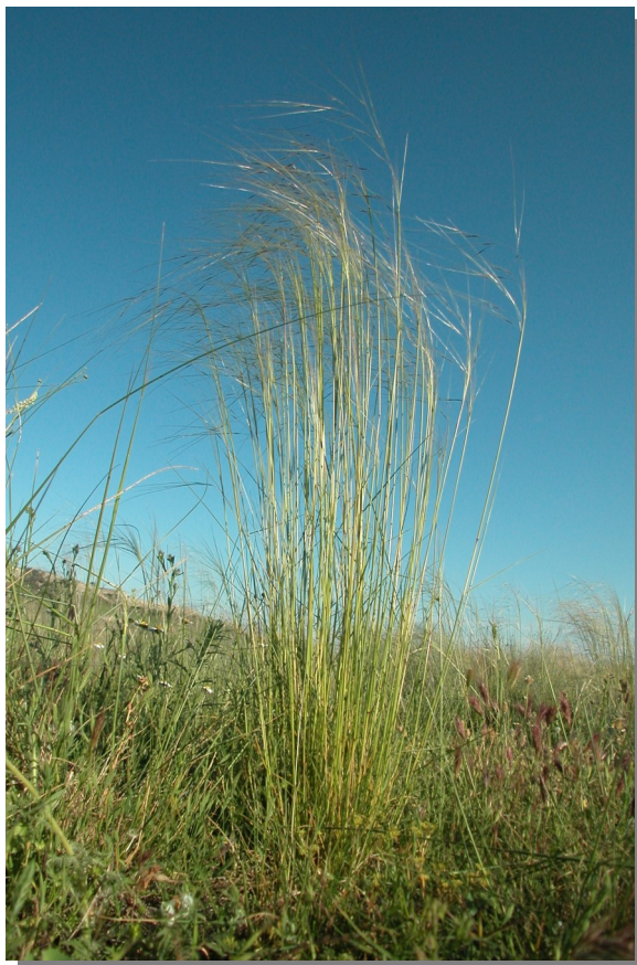
Farlé; Pina de Ebro (13/05/2013)