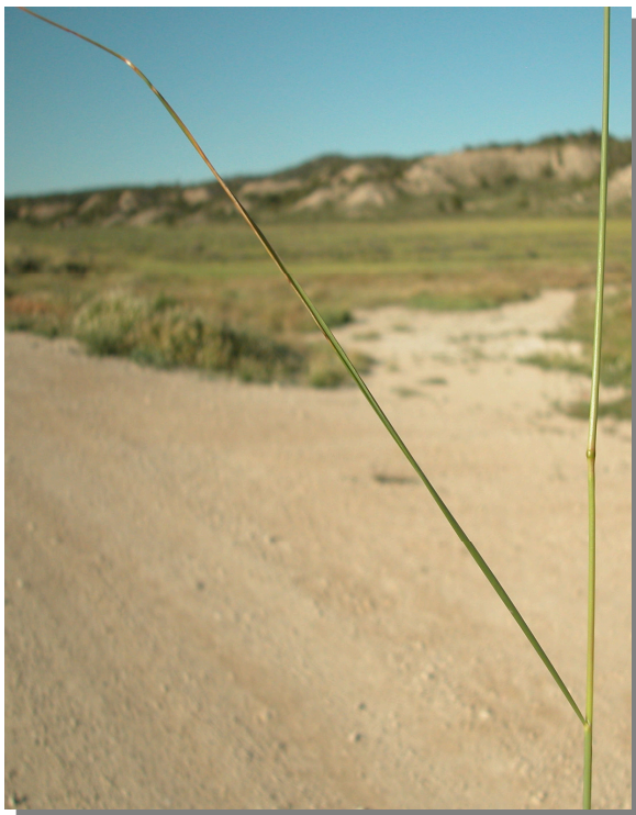
S. parviflora . Detalle de la hoja: envés