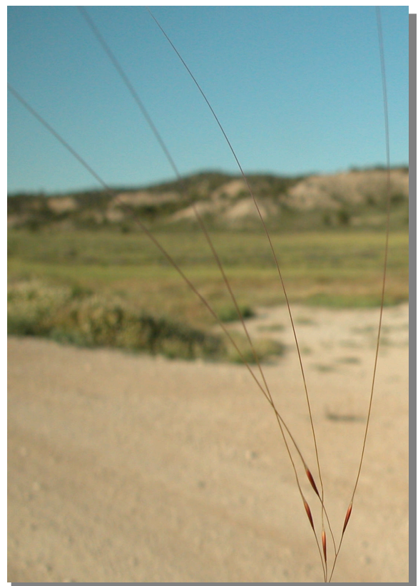
S. parviflora . Espiguilla