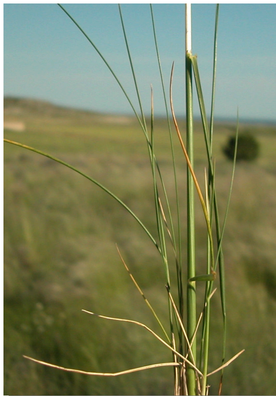
S. parviflora . Detalle de hojas basales