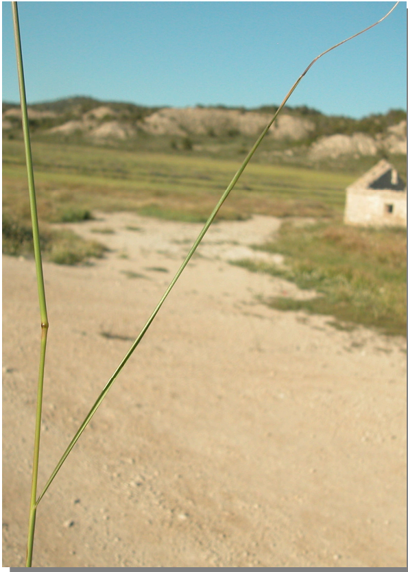
S. parviflora . Detalle de la hoja: haz