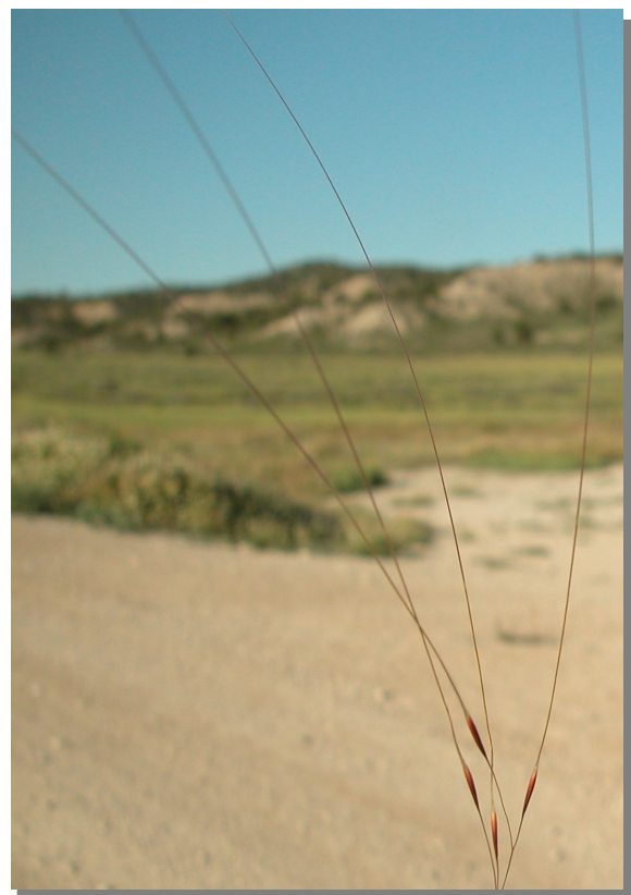
S. parviflora . Espiguilla