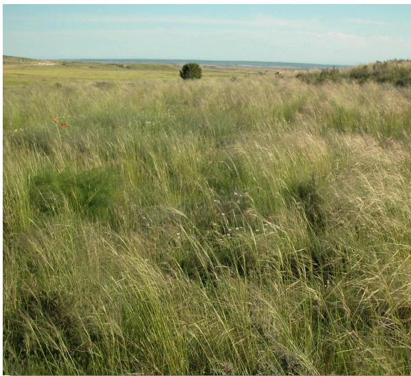
Formación de S. parviflora