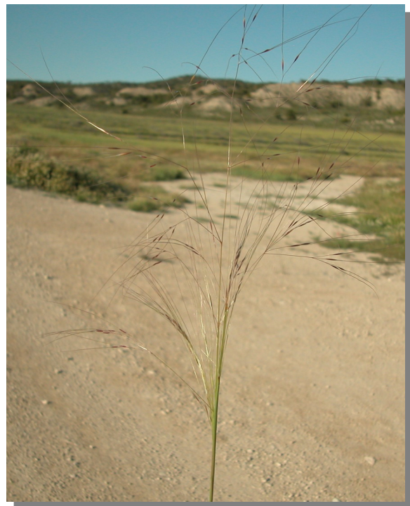
S. parviflora . Inflorescencia