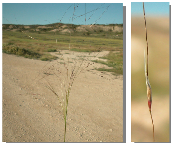
S. parviflora . Inflorescencia y espiguilla