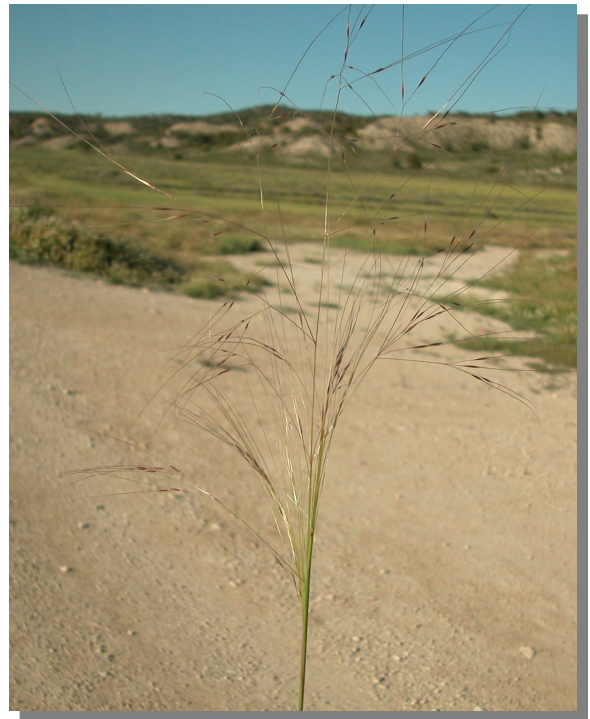
S. parviflora . Inflorescencia