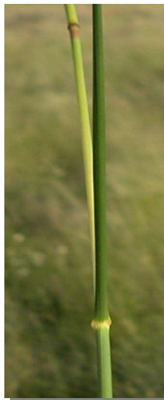
S. parviflora . Detalle del tallo