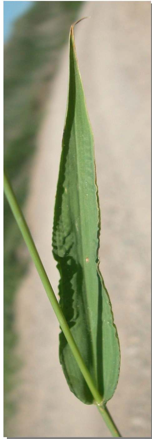
S. adhaerens . Detalle de la hoja: haz