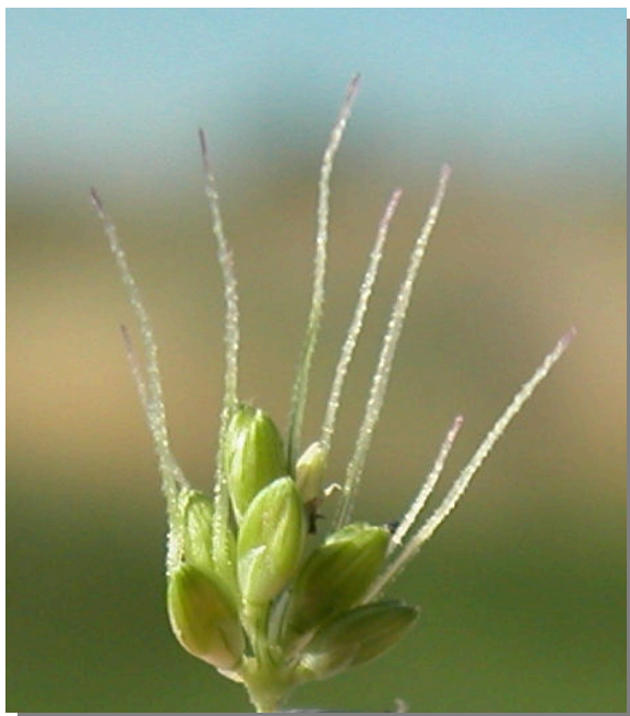
S. adhaerens . Espiguilla