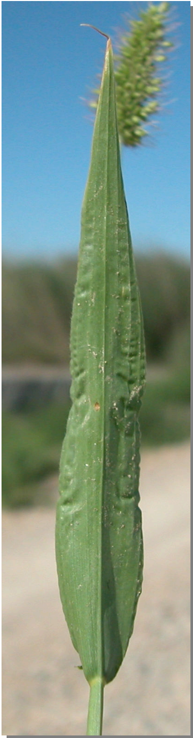
S. adhaerens . Detalle de la hoja: envés