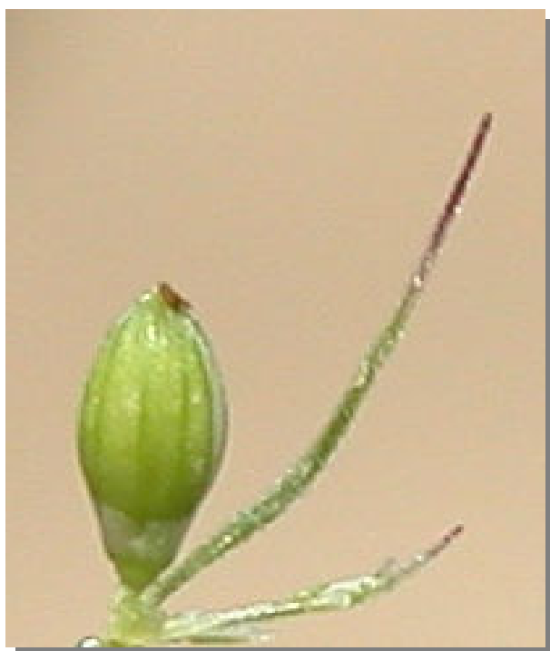
S. adhaerens . Espiguilla