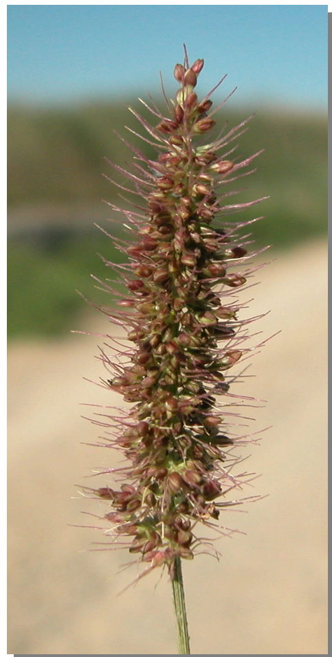
S. adhaerens . Inflorescencia