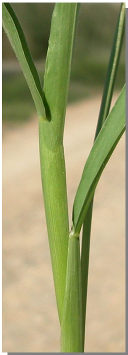
S. adhaerens . Detalle del tallo