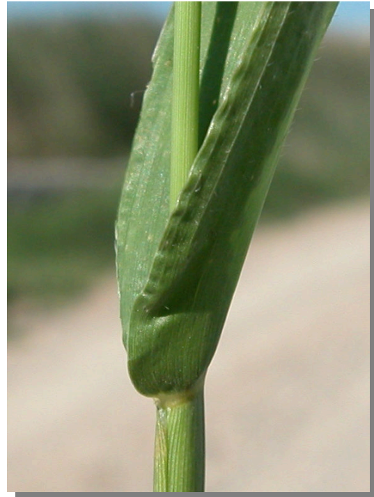
S. adhaerens . Detalle de vaina foliar