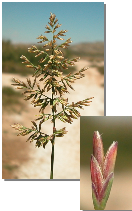
P. rupestris . Inflorescencia y espiguilla