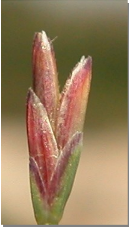
P. rupestris . Espiguilla