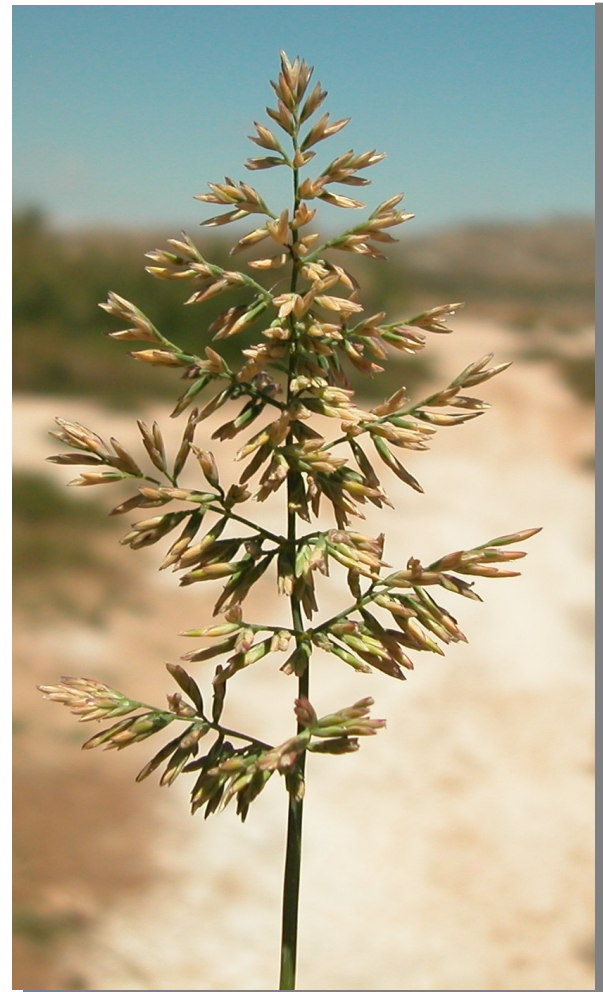
P. rupestris . Inflorescencia