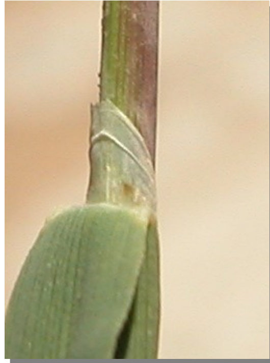
P. rupestris . Detalle de la lígula