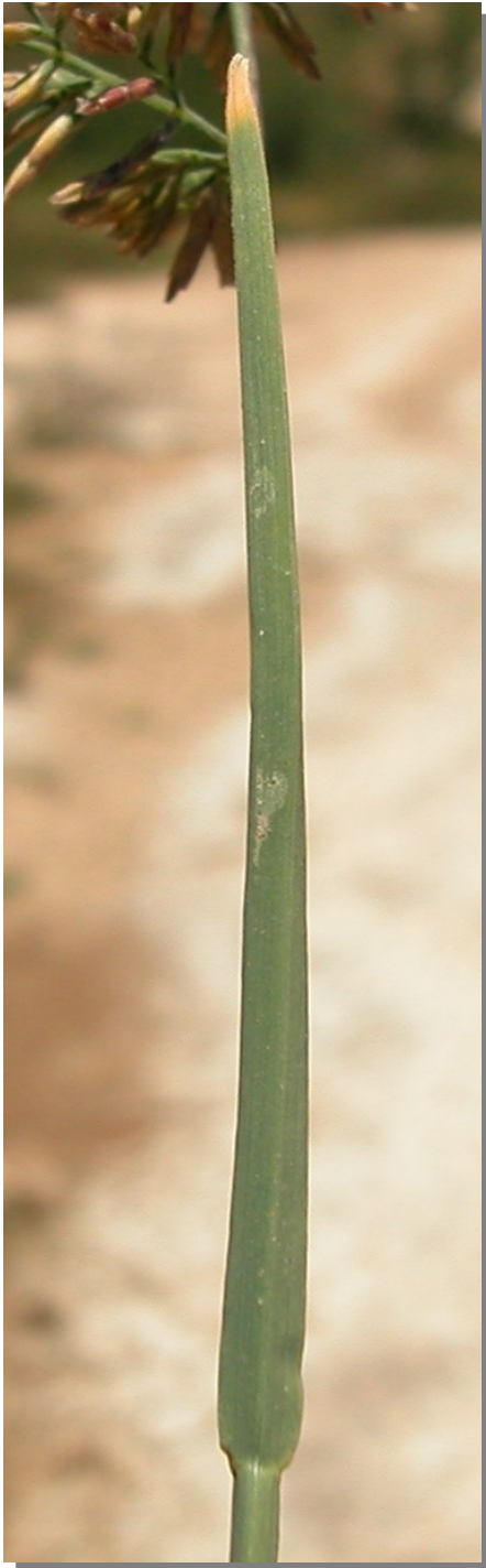
P. rupestris . Detalle de la hoja: envés