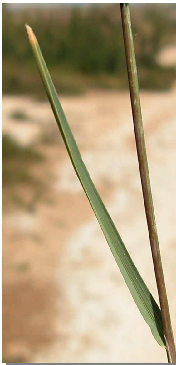
P. rupestris . Detalle de la hoja: haz