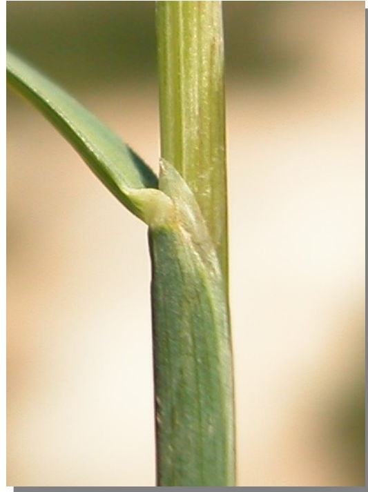
P. fasciculata . Detalle de la lígula