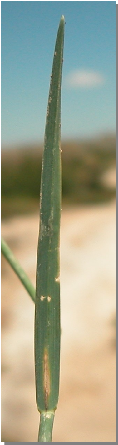
P. fasciculata . Detalle de la hoja: envés