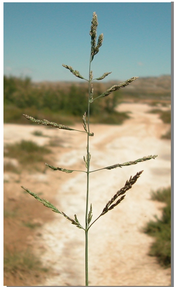
P. fasciculata . Inflorescencia