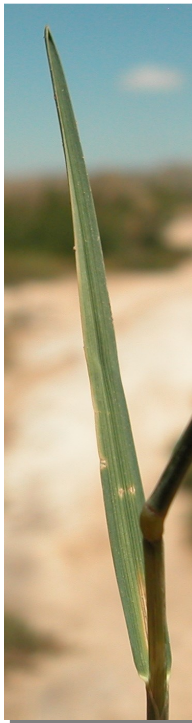
P. fasciculata . Detalle de la hoja: haz