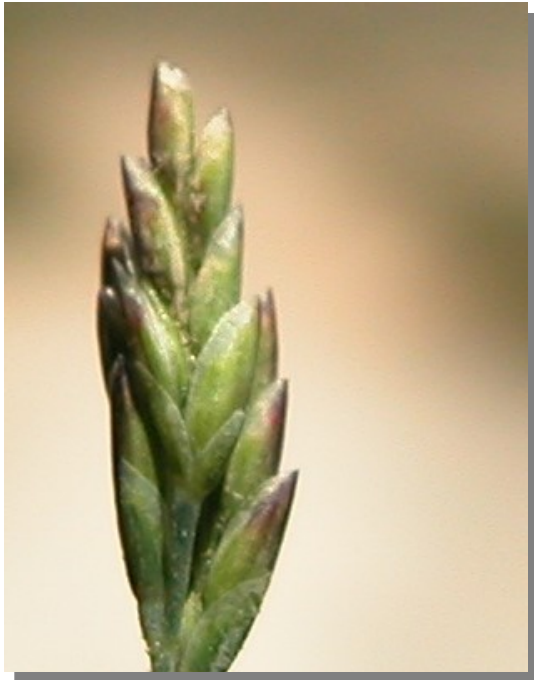
P. fasciculata . Espiguilla