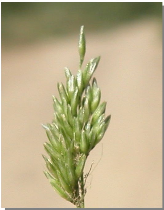
P. viridis . Espiguilla