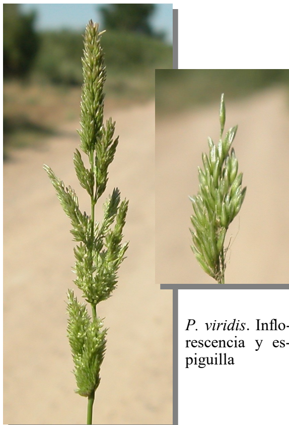
P. viridis . Inflorescencia y espiguilla