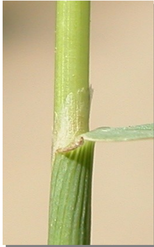
P. viridis . Detalle de la lígula