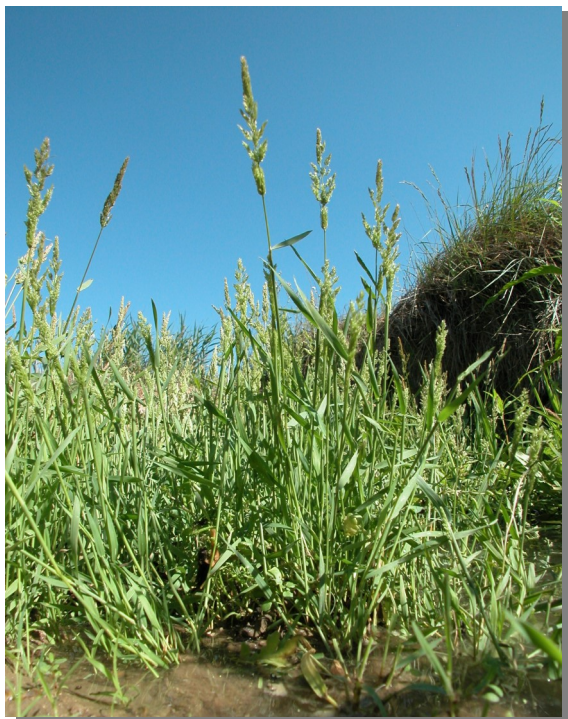
Talavera; Pina de Ebro (07/07/2013)