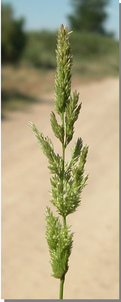
P. viridis . Inflorescencia