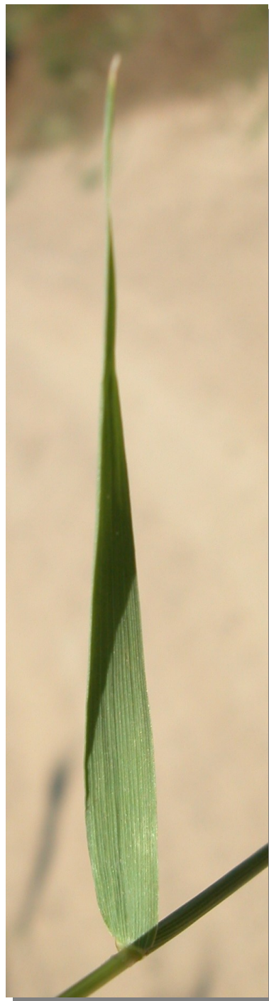
P. viridis . Detalle de la hoja: haz