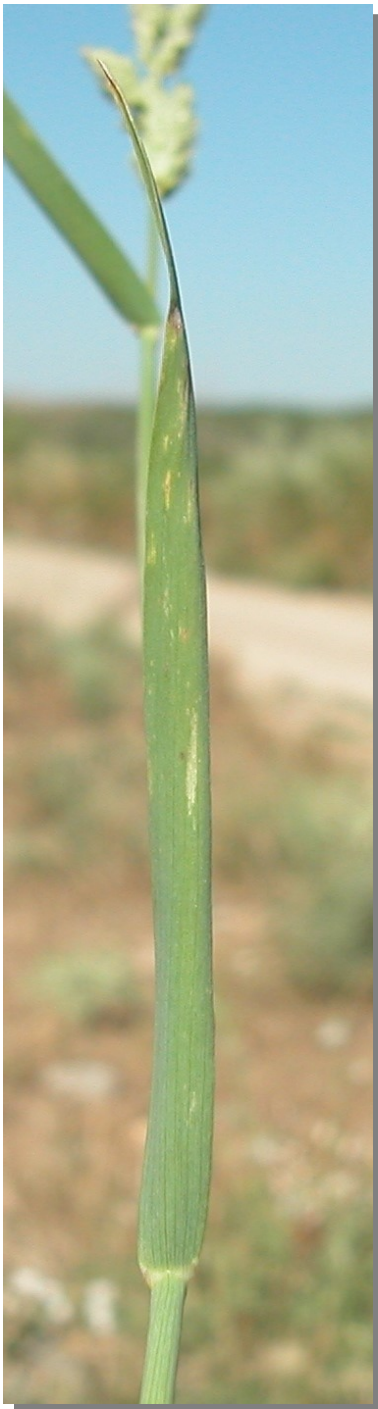
P. viridis . Detalle de la hoja: envés