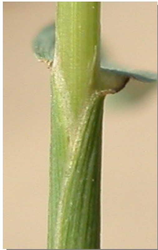
P. viridis . Detalle de la lígula