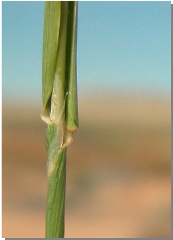
P. monspeliensis . Detalle de la lígula