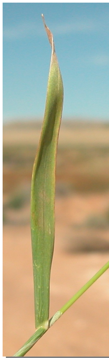
P. monspeliensis . Detalle de la hoja: envés