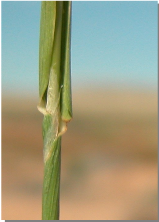
P. monspeliensis . Detalle de la lígula