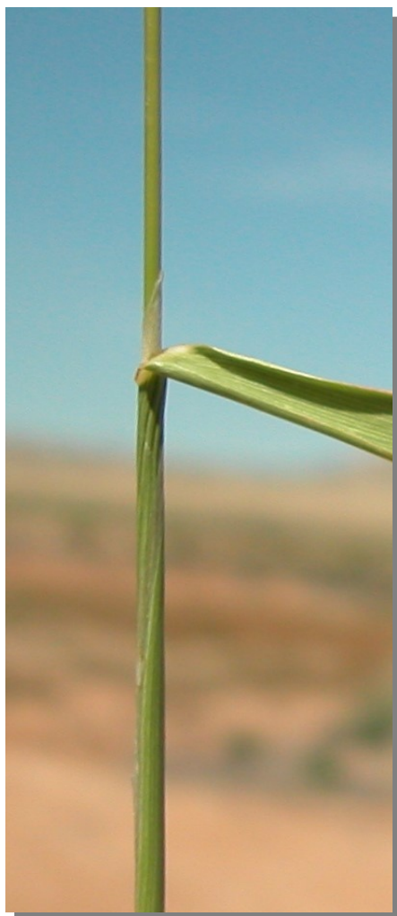
P. monspeliensis . Detalle del tallo