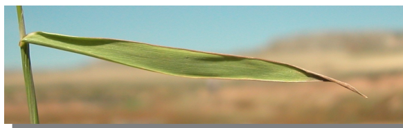
P. monspeliensis . Detalle de la hoja: haz