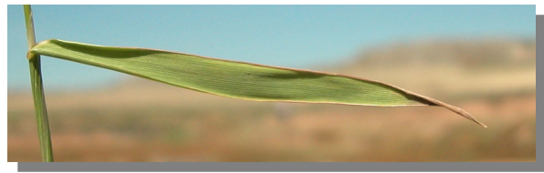
P. monspeliensis . Detalle de la hoja: haz