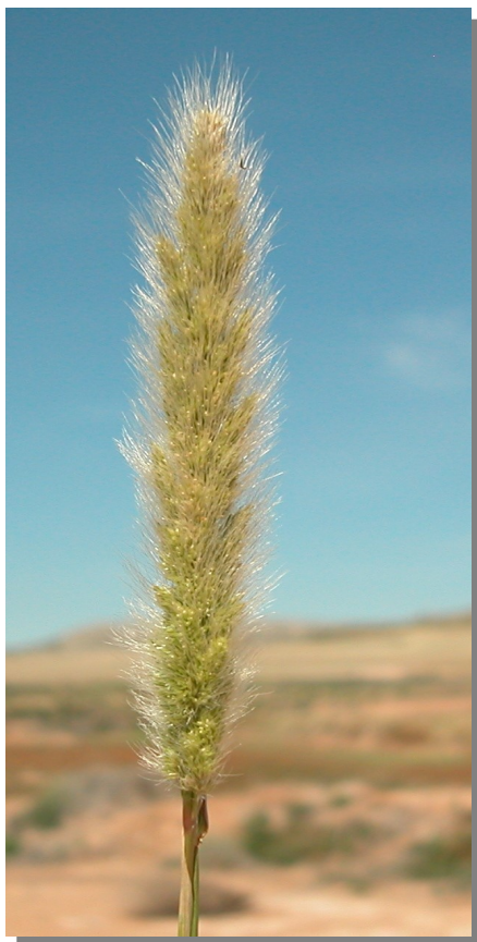
P. monspeliensis . Inflorescencia