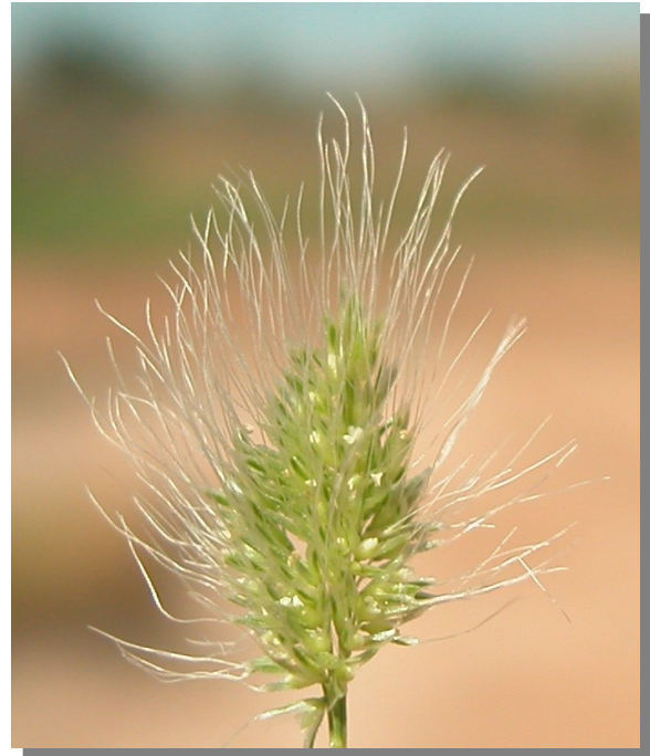
P. monspeliensis . Espiguilla