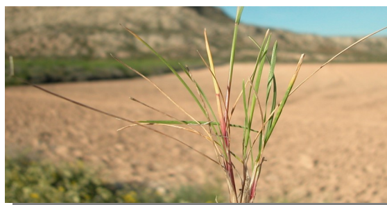
P. bulbosa . Detalle de hojas basales