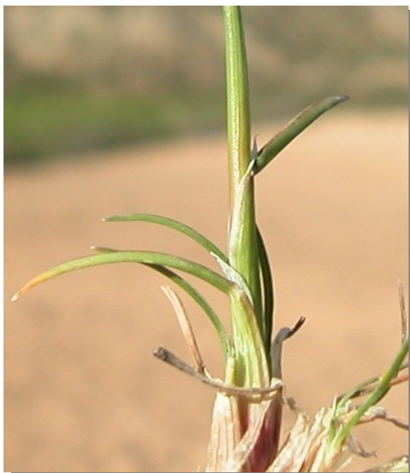
P. bulbosa . Base del tallo engrosada