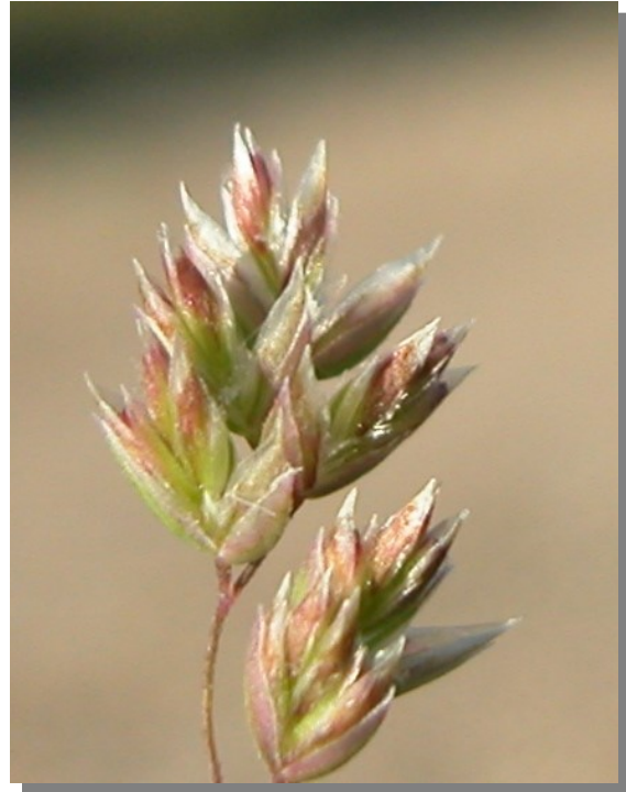
P. bulbosa . Espiguillas