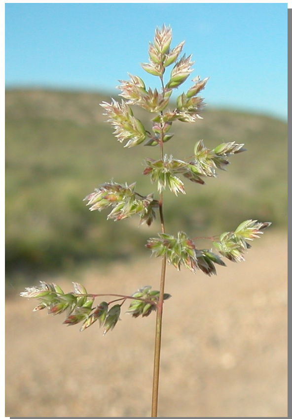
P. bulbosa . Inflorescencia