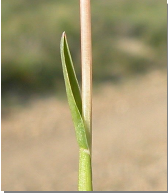
P. bulbosa . Detalle de hoja superior: haz