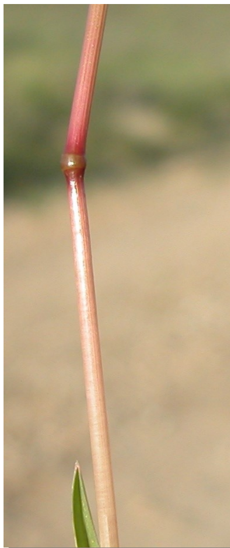
P. bulbosa . Detalle del tallo