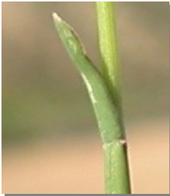
P. bulbosa . Detalle de hoja superior: envés