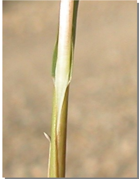
P. bulbosa . Detalle de la lígula