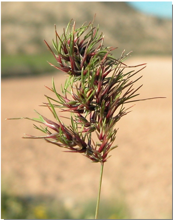
P. bulbosa . Inflorescencia