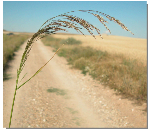
P. miliaceum . Detalle de la inflorescencia