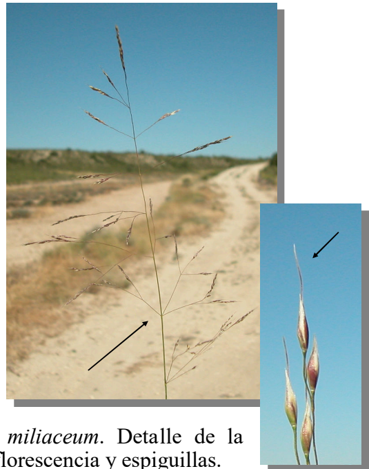
P. miliaceum . Detalle de la inflorescencia y espiguillas.