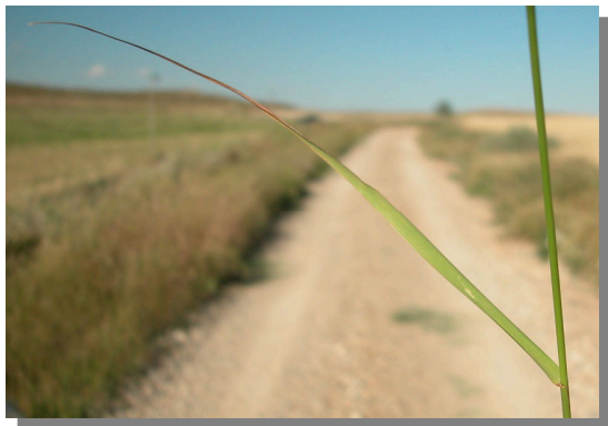
P. miliaceum . Detalle de la hoja: haz