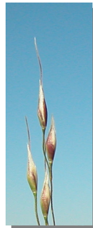
P. miliaceum . Detalle de las espiguillas