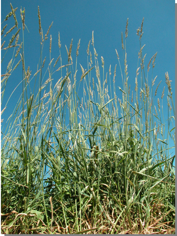
El Llano; Pina de Ebro (12/06/2013)