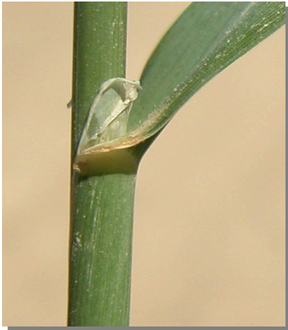
Ph. arundinacea . Detalle de la lígula