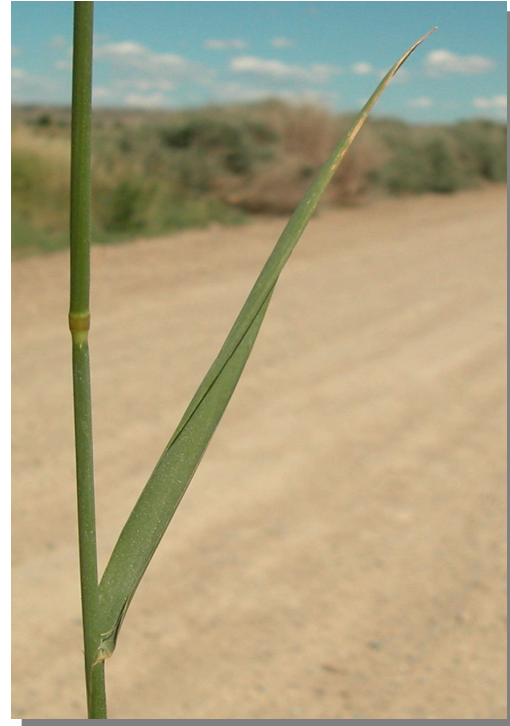
Ph. arundinacea . Detalle de la hoja: haz