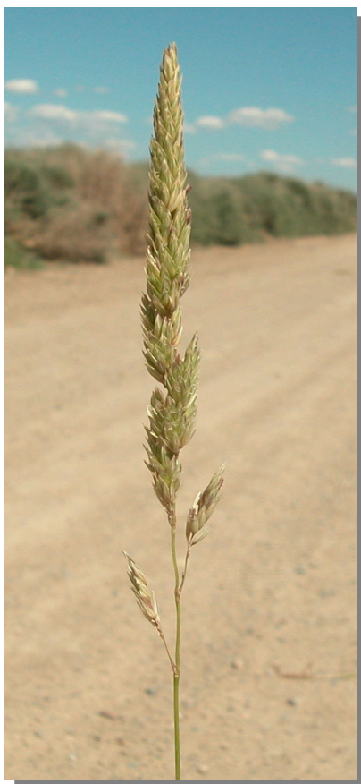
Ph. arundinacea . Inflorescencia