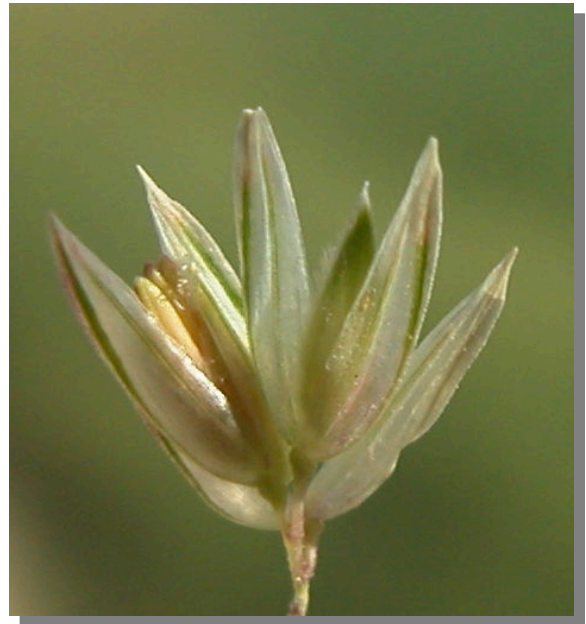
Ph. arundinacea . Espiguilla