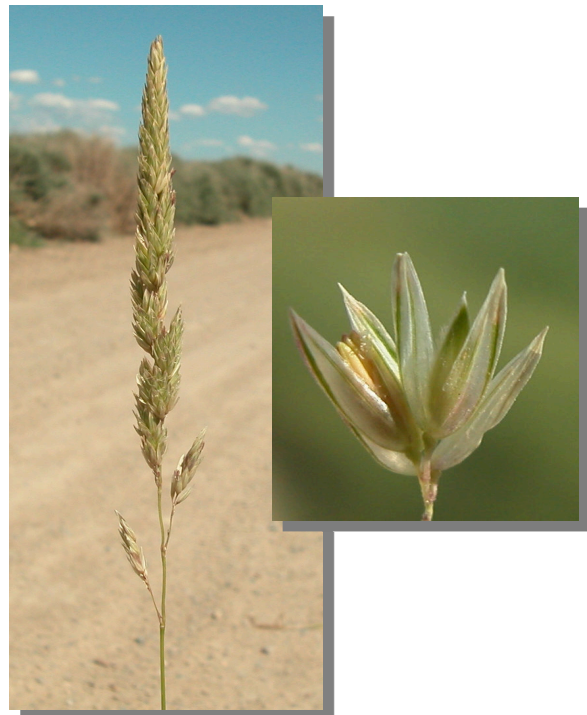
Ph. arundinacea . Inflorescencia y espiguilla