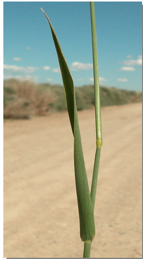
Ph. arundinacea . Detalle de la hoja: envés