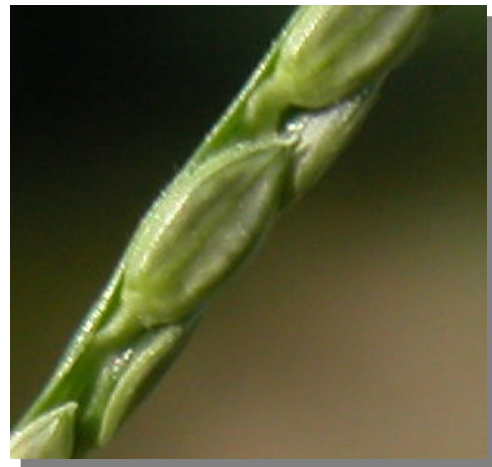
P. distichum . Detalle de la espiguilla