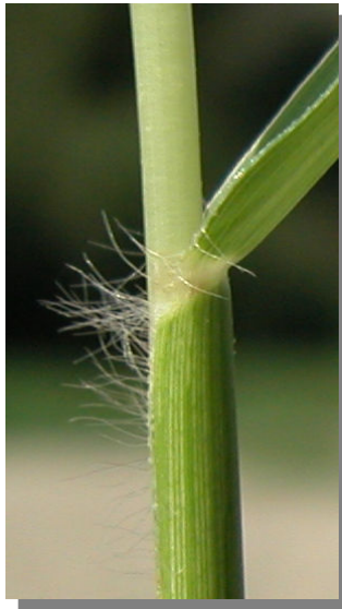
P. distichum . Detalle de la vellosidad en la vaina de la hoja