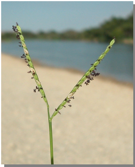
P. distichum . Detalle de la inflorescencia