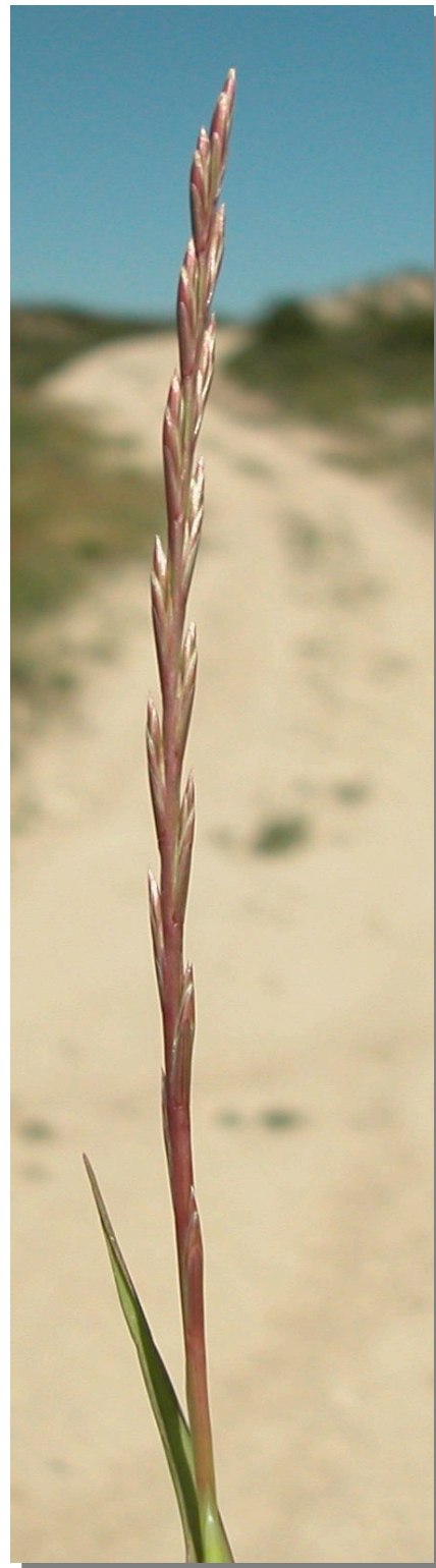
L. rigidum . Espiga