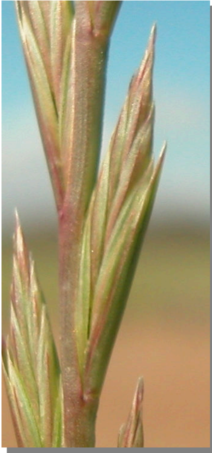
L. rigidum . Espiguilla