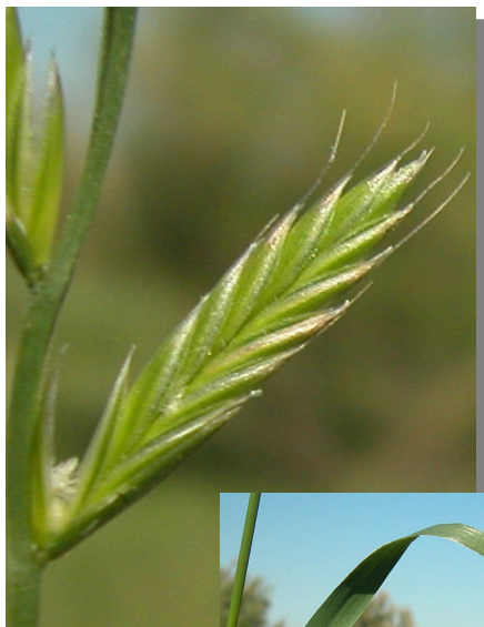
L. multiflorum . Espiguilla con aristas y hojas planas.

El tener juntas espiguillas sin aristas y hojas plegadas diferencian a esta especie de las demás del género Lolium de la Comarca.