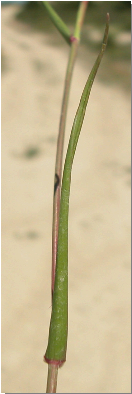
L. rigidum . Detalle de la hoja: envés