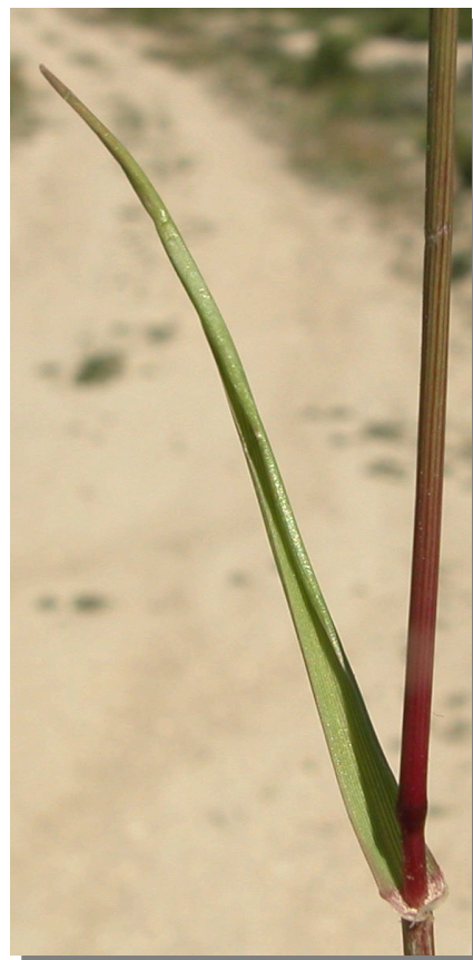
L. rigidum . Detalle de la hoja: haz