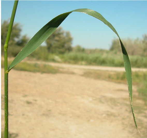
L. multiflorum . Detalle de la hoja: haz