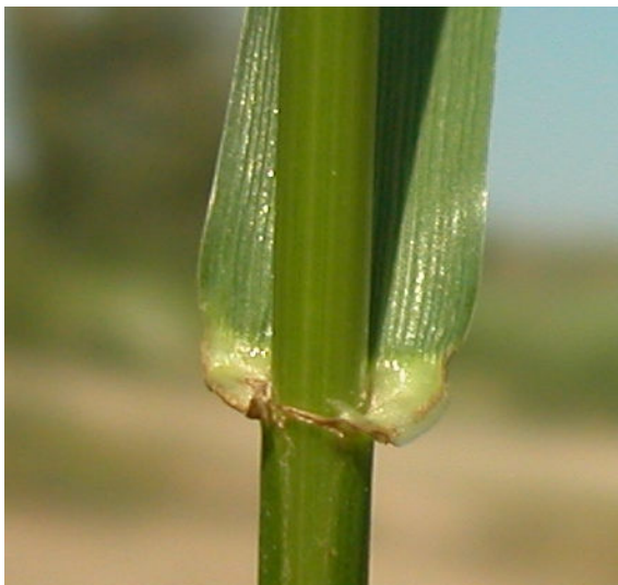
L. multiflorum . Detalle de la lígula