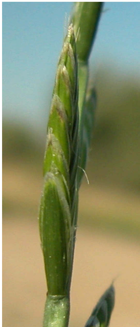
L. multiflorum . Espiguilla