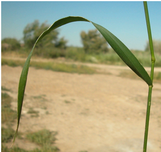
L. multiflorum . Detalle de la hoja: envés