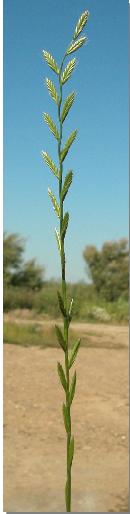
L. multiflorum . Espiga