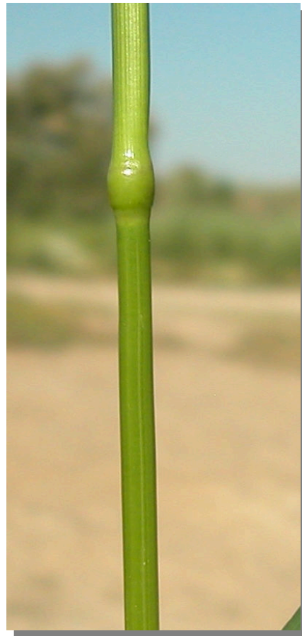
L. multiflorum . Detalle del tallo