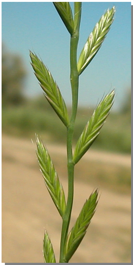
L. multiflorum . Espiguillas