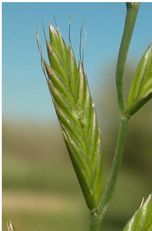
L. multiflorum . Espiguilla