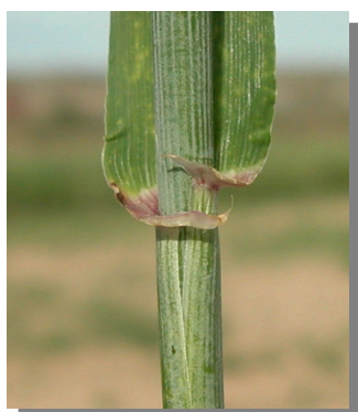
H. vulgare . Detalle de las aurículas