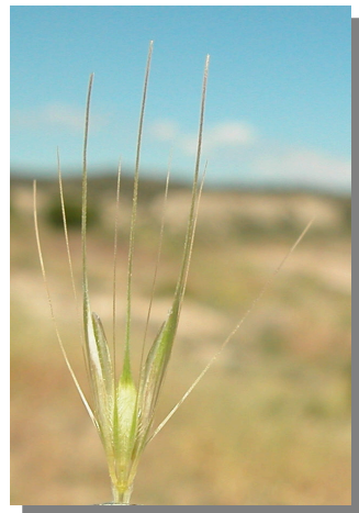
Hordeum murinum : detalle de espiga y espiguilla