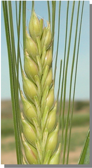
H. vulgare . Detalle de la espiga