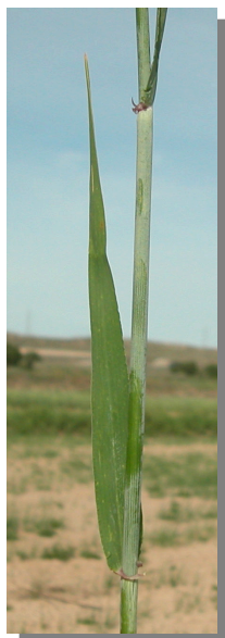
H. vulgare . Detalle de la hoja: haz