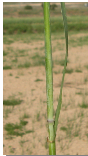
H. vulgare . Detalle del tallo