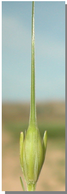
H. vulgare . Detalle de la espiguilla