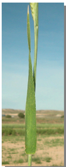
H. vulgare . Detalle de la hoja: envés