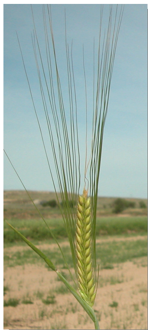
H. vulgare . Detalle de la espiga