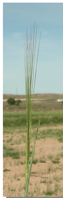
H. vulgare . Detalle de la espiga