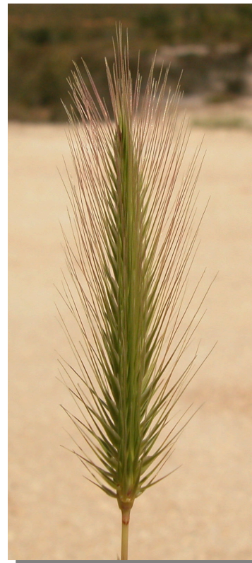
H. marinum . Espiga