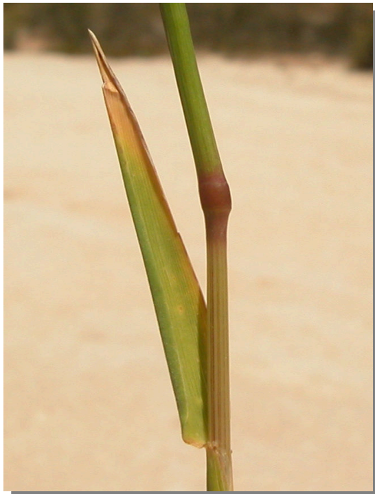
H. marinum . Detalle de la hoja: haz