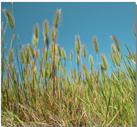
Salada del Rollico; Sástago (02/06/2013)