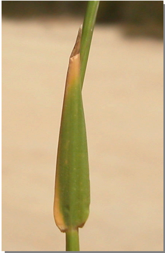
H. marinum . Detalle de la hoja: envés