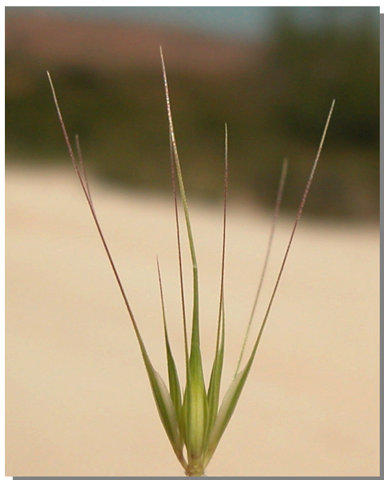
H. marinum . Espiguilla