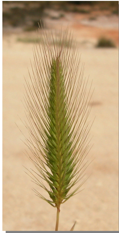
H. marinum . Espiga