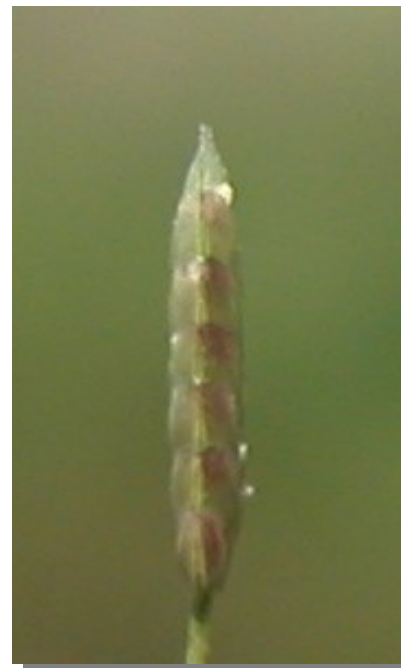
E. minor . Espiguilla