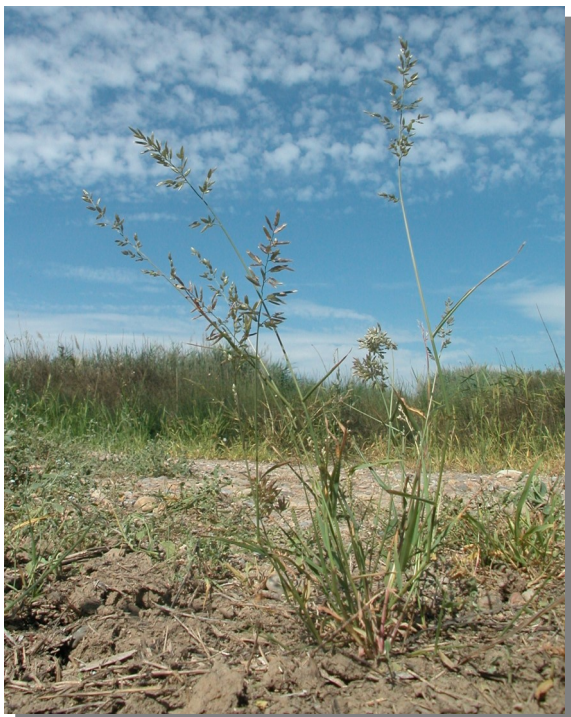
Talavera; Pina de Ebro (29/07/2013)