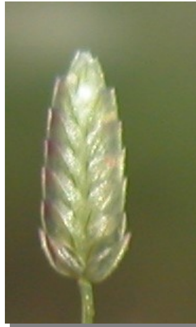
E. minor . Espiguilla