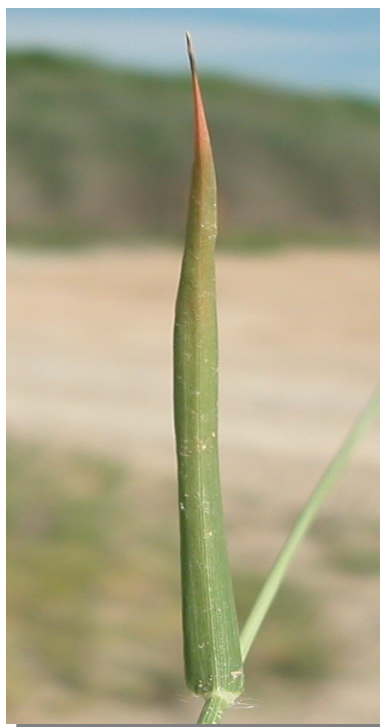
E. minor . Detalle de la hoja: envés