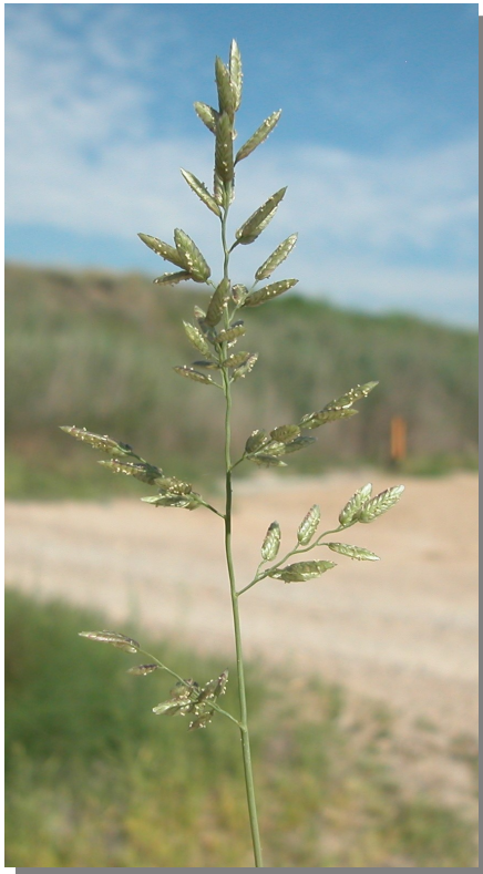
E. minor . Detalle de la inflorescencia