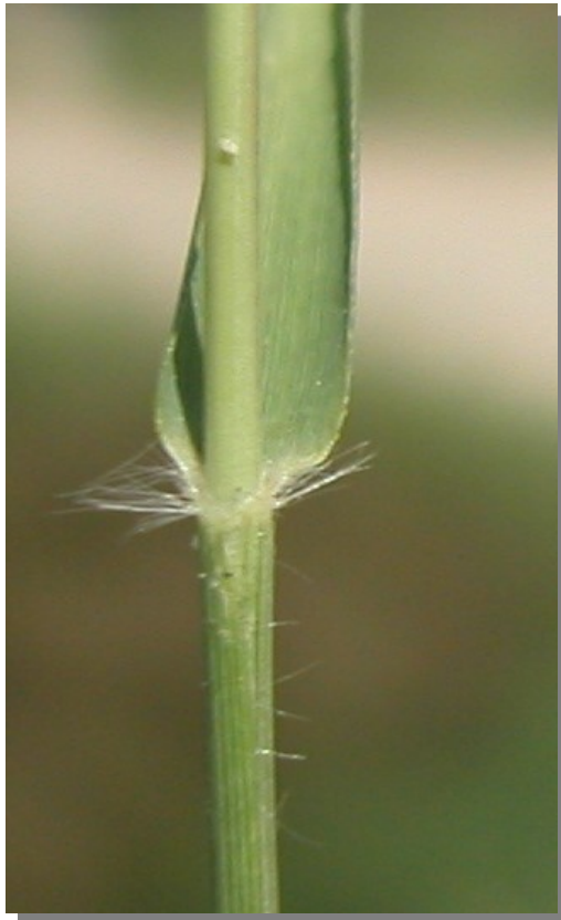
E. minor . Detalle de la vaina