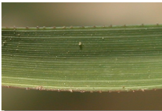
E. minor . Detalle del borde de la hoja