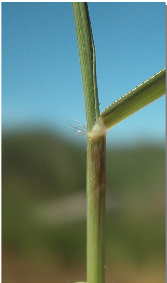
E. minor . Detalle del tallo