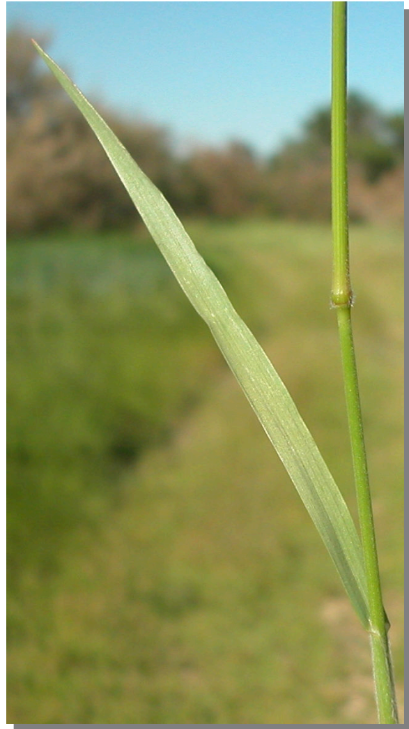
B. racemosus . Detalle de la hoja: haz