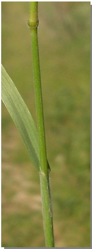
B. racemosus . Detalle del tallo