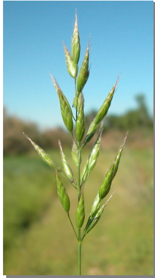
B. racemosus . Detalle de la inflorescencia