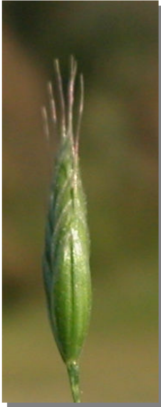
B. racemosus . Detalle de la espiguilla