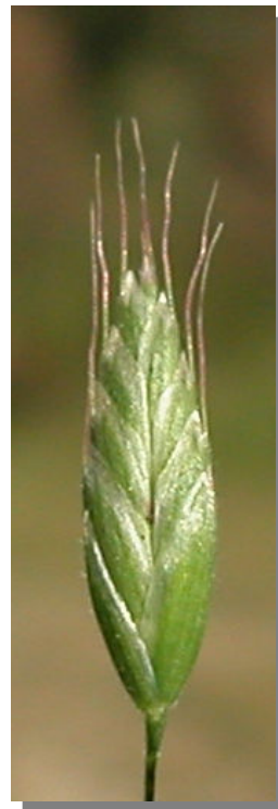
B. racemosus . Detalle de la espiquilla