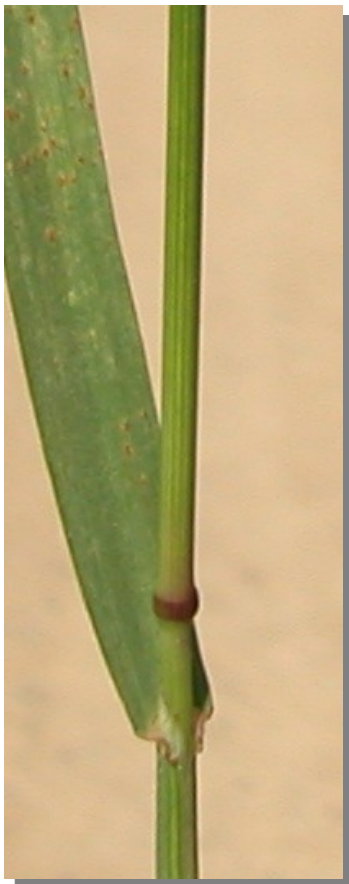
B. diandrus . Detalle del tallo