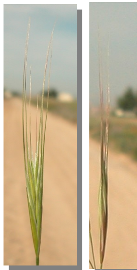
B. diandrus. Detalle de la espiguilla

Gluma inferior con 1 nervio, la superior con 3.