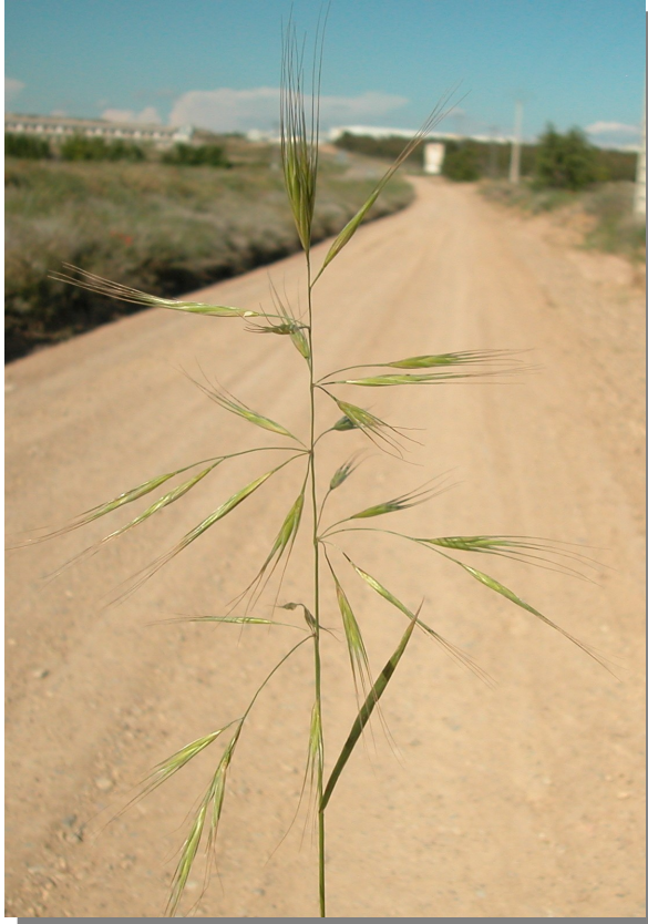
B. diandrus . Detalle de la inflorescencia