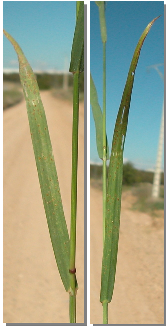
B. diandrus . Detalle de la hoja: haz y envés