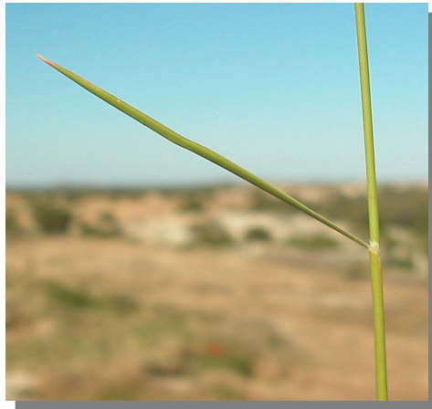
B. retusum . Detalle de una hoja