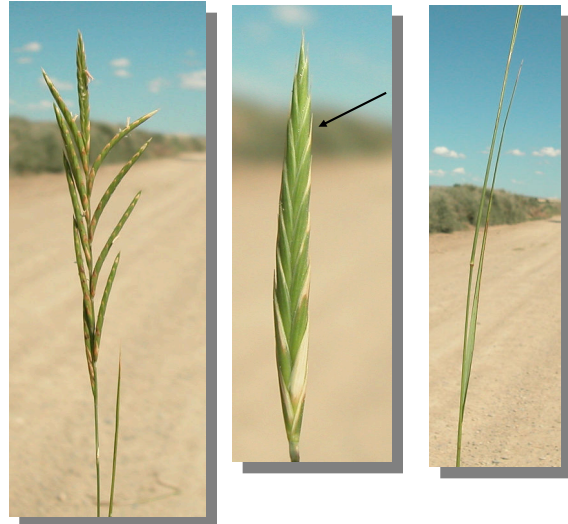
B. phoenicoides . Inflorescencia con arista corta, pero con 10 espiguillas, tallos no ramificados y con hojas paralelas al tallo