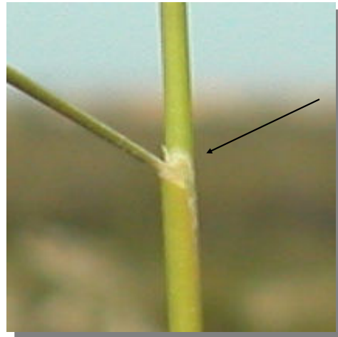
B. retusum . Detalle de la lígula