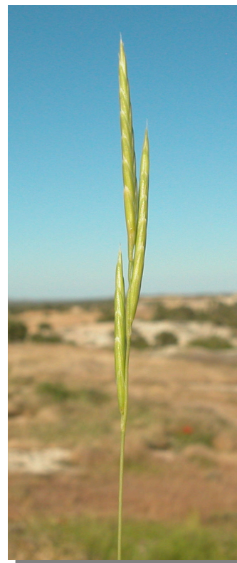
B. retusum . Detalle de la inflorescencia