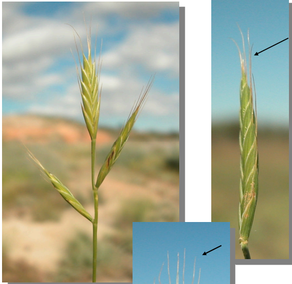
B. distachyon . Espiguillas con arista larga.

De las 3 especies más del género Brachypodium presentes en la Comarca, B. distachyon y B. sylvaticum tienen espiguillas con arista larga; B. phoenicoides tiene espiguillas con arista corta, pero la inflorescencia tiene más de 8 espiguillas, tallos poco ramificados, hojas paralelas al tallo y mayores de 10 cm de longitud.