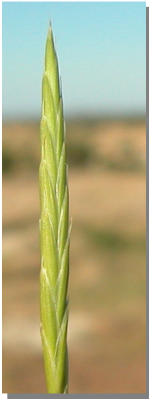
B. retusum . Detalle de la espiguilla