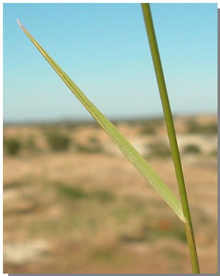
B. retusum . Detalle de una hoja: haz