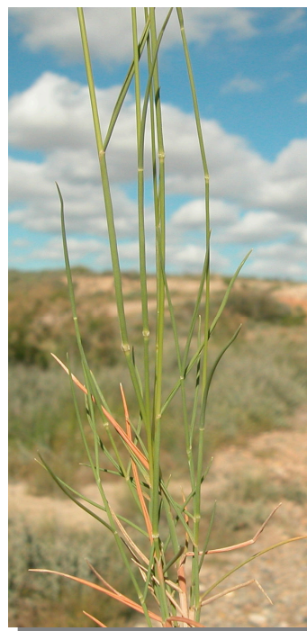
B. retusum . Detalle de tallos