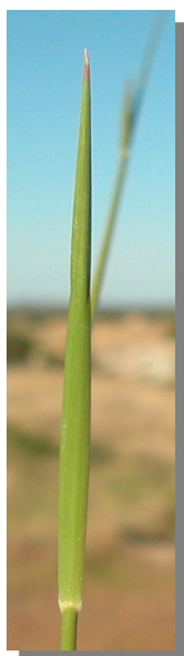
B. retusum . Detalle de una hoja: envés