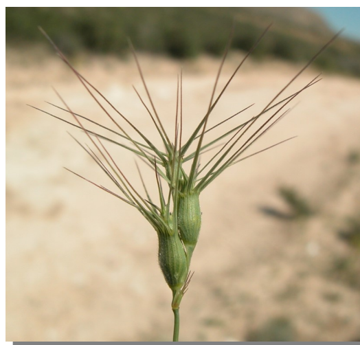
A. geniculata . Espiga ovoidea y ventruda

Glumas con 3-5 aristas con longitud similar a la de los lemas.