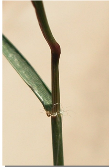
A. geniculata . Detalle del tallo