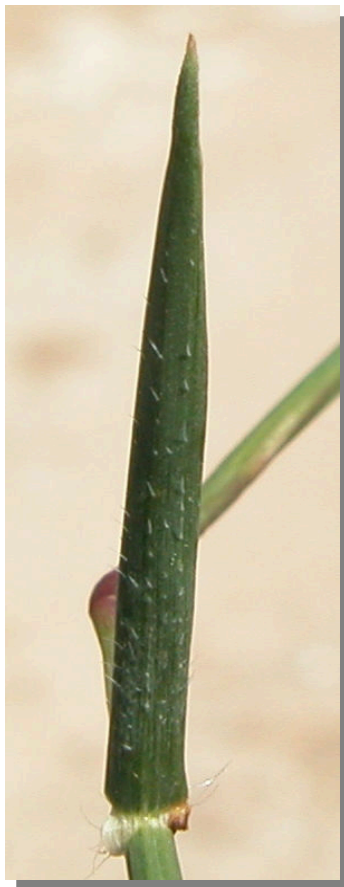
A. geniculata . Detalle de la hoja: envés