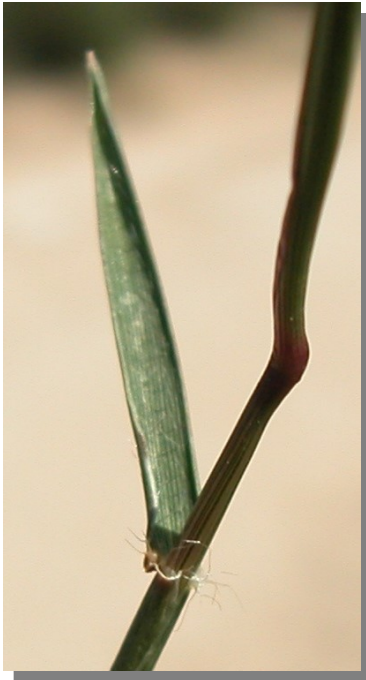
A. geniculata . Detalle de la hoja: haz