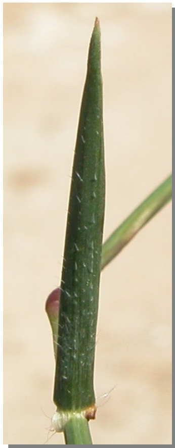
A. geniculata . Detalle de la hoja: envés