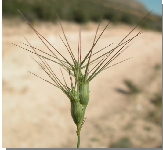
A. geniculata . Detalle de la inflorescencia