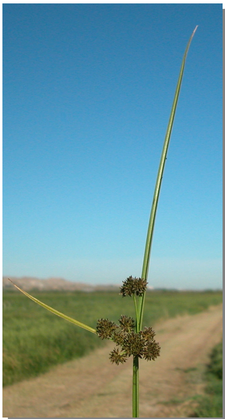
C. difformis . Detalle de la inflorescencia y brácteas