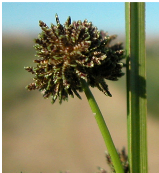
C. difformis . Detalle de las espiguillas