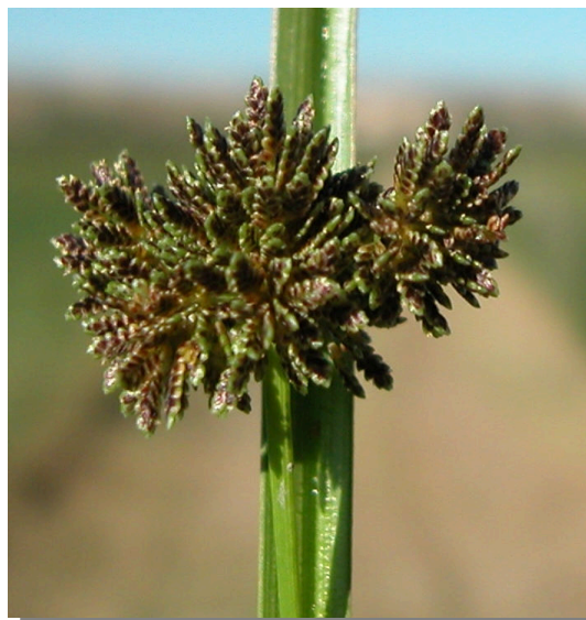
C. difformis . Detalle de las espiguillas