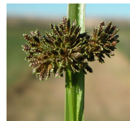
C. difformis . Detalle de la inflorescencia y de las espiguillas.