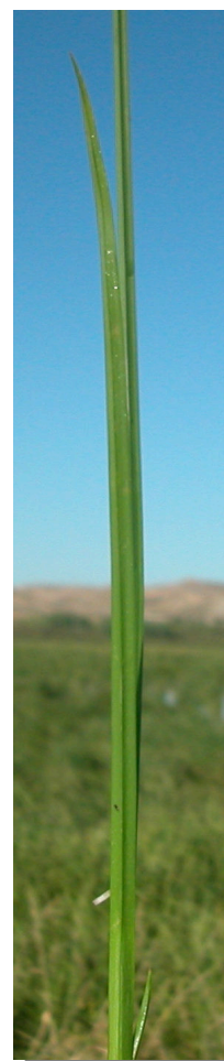
C. difformis . Detalle de la hoja: haz y envés