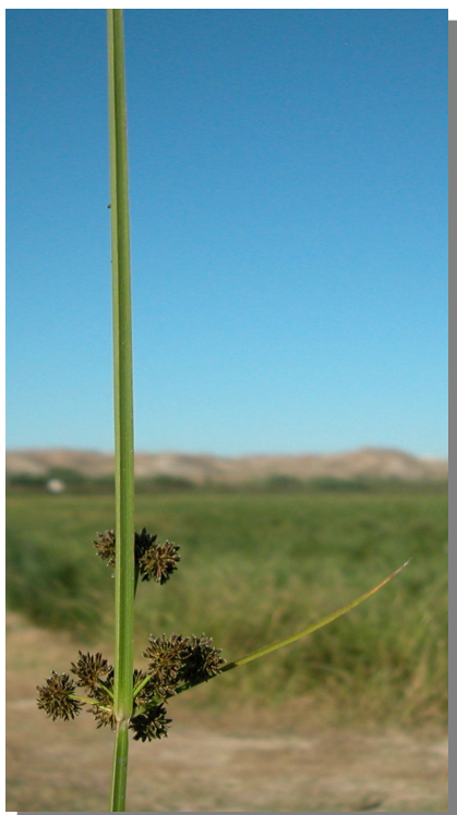
C. difformis . Detalle de la inflorescencia y brácteas