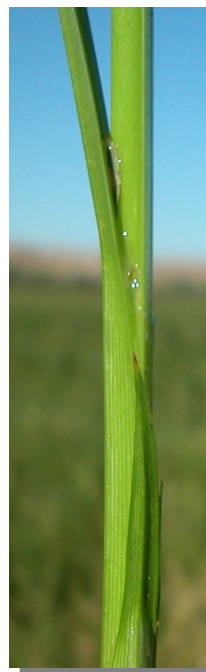
C. difformis . Detalle del tallo y vaina de las hojas