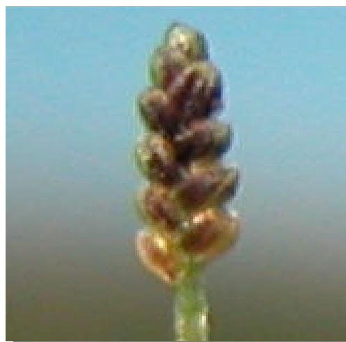
C. difformis . Detalle de una espiguilla