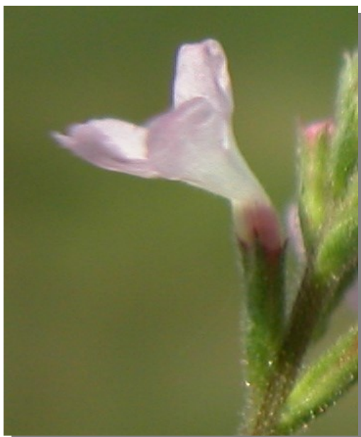
V. officinalis . Detalle del cáliz