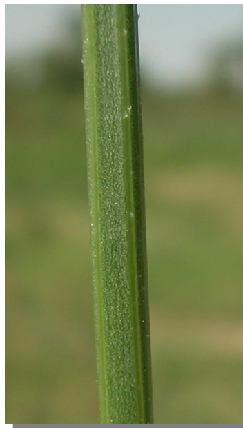
V. officinalis . Detalle del tallo