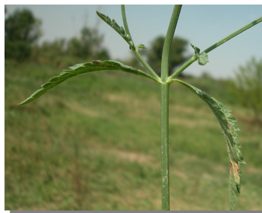
V. officinalis . Detalle del tallo con hojas