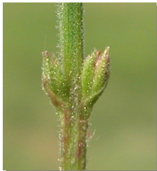
V. officinalis . Detalle del fruto