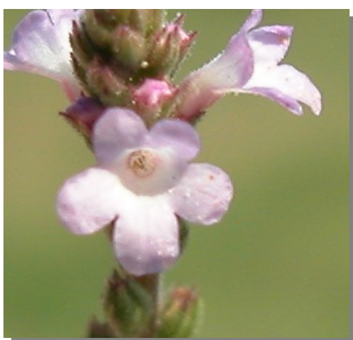
V. officinalis . Detalle de la corola