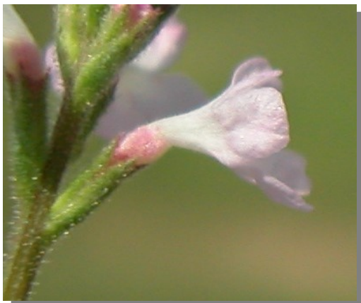
V. officinalis . Detalle de la flor