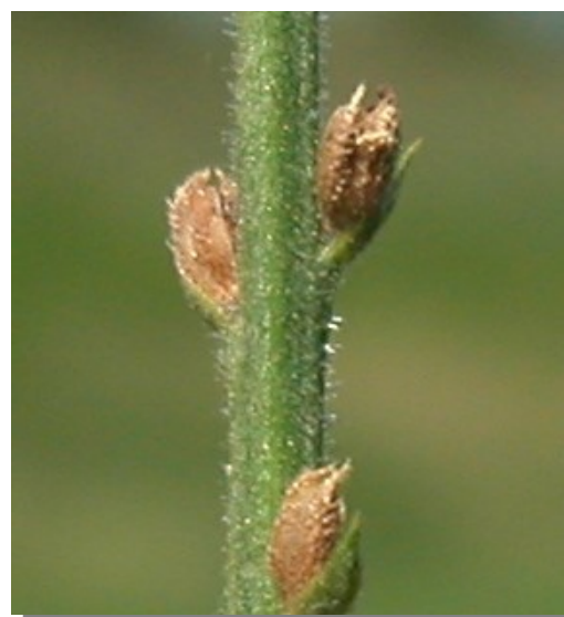
V. officinalis . Detalle del fruto