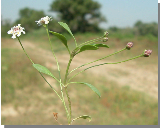
P. filiformis . Detalle del tallo con cabezuelas florales y hojas