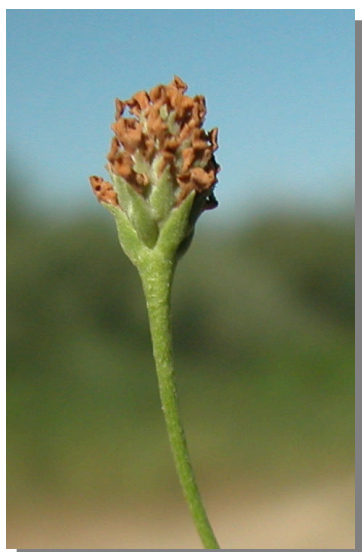
P. filiformis . Detalle de cabezuela con fru-