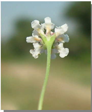
P. filiformis . Detalle de cabezuela floral