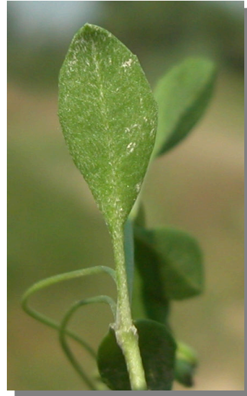
P. filiformis . Detalle de la hoja: envés