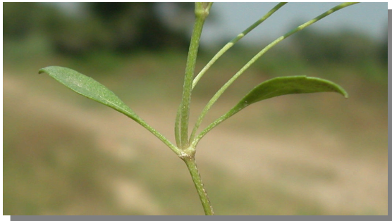
P. filiformis . Detalle de las hojas