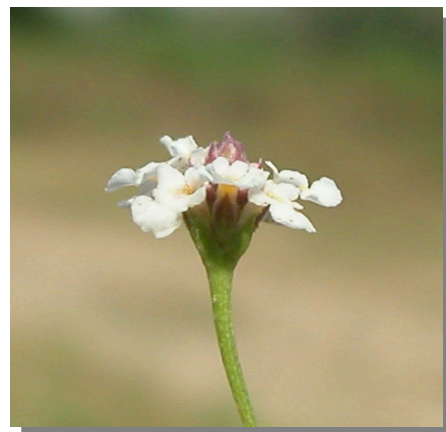
P. filiformis . Detalle de cabezuela floral