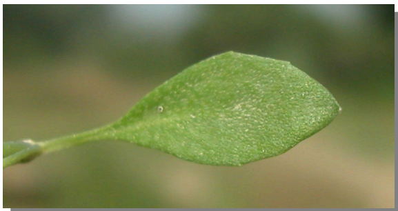
P. filiformis . Detalle de la hoja: haz