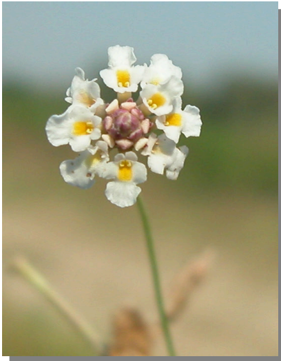
P. filiformis . Detalle de cabezuela floral