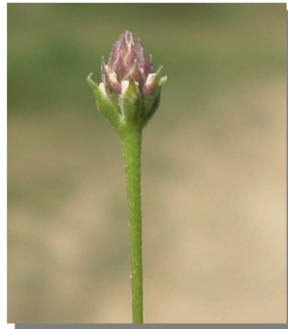
P. filiformis . Detalle de cabezuela floral juvenil