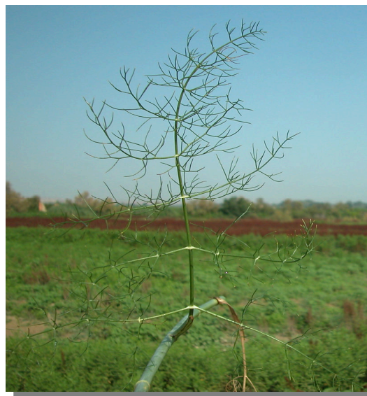
F. vulgare . Detalle de hoja basal: haz.