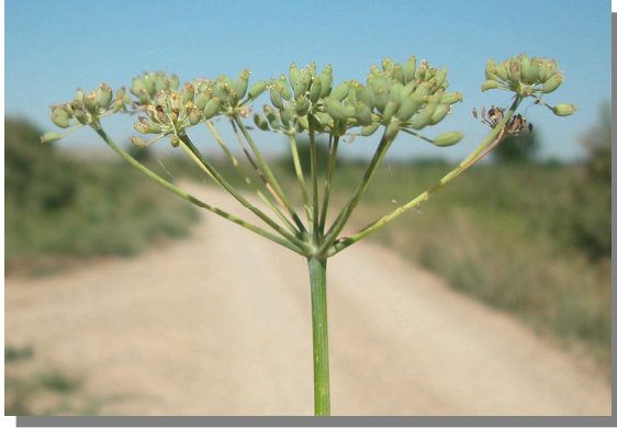
F. vulgare . Detalle de umbela en fruto