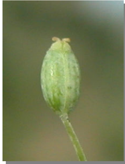
F. vulgare . Detalle de un fruto maduro