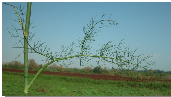
F. vulgare . Detalle de hoja basal.