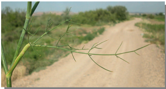
F. vulgare . Detalle de hoja media.