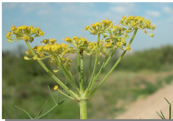
F. vulgare . Detalle de umbela en flor