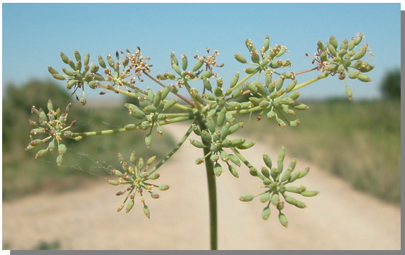
F. vulgare . Detalle de umbela en fruto