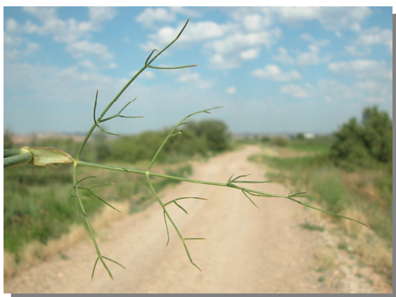
F. vulgare . Detalle de hoja media: haz