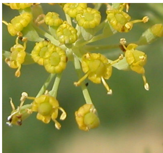
F. vulgare . Detalle de las flores