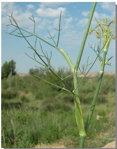
F. vulgare . Detalle de hoja media: envés