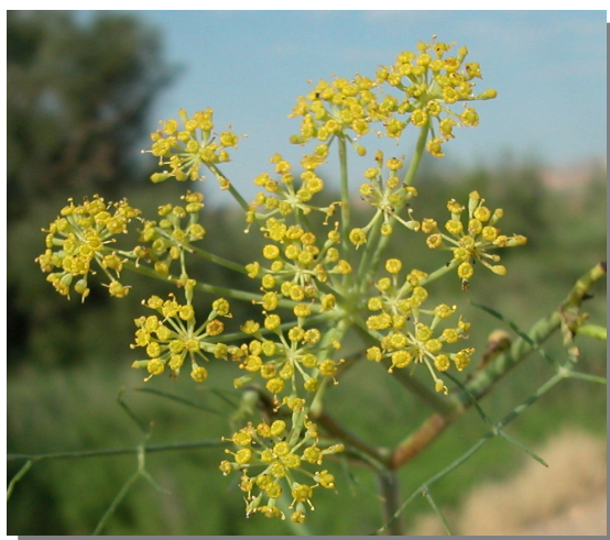
F. vulgare . Detalle de umbela en flor