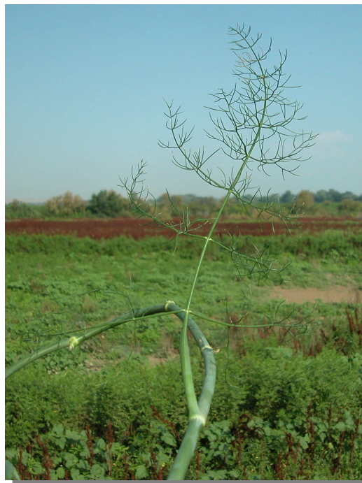
F. vulgare . Detalle de hoja basal: envés