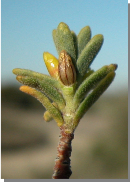
T. tinctoria . Detalle de flores femeninas en la fructificación