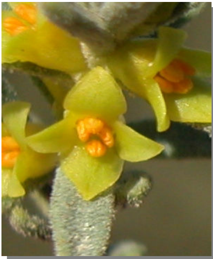
T. tinctoria . Detalle de flor masculina