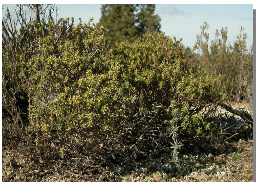
Retuerta de Pina, Pina de Ebro (30/01/2016). Pie femenino