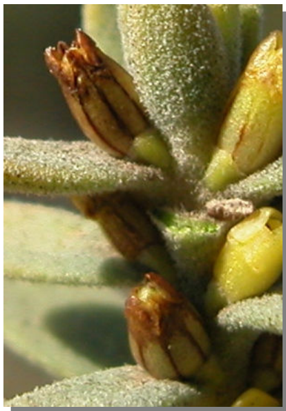
T. tinctoria . Detalle del fruto