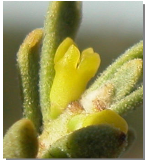
T. tinctoria . Detalle de flor femenina