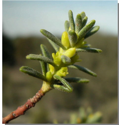
T. tinctoria . Detalle de rama con flores femeninas