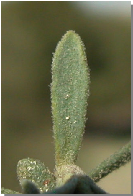
T. tinctoria . Detalle de la hoja: haz