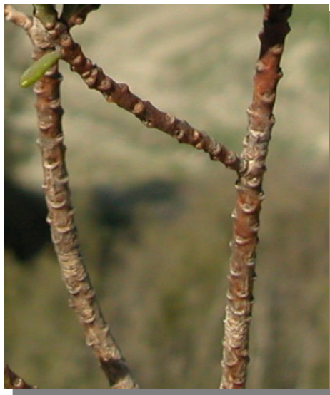
T. tinctoria . Detalle de tallos nuevos