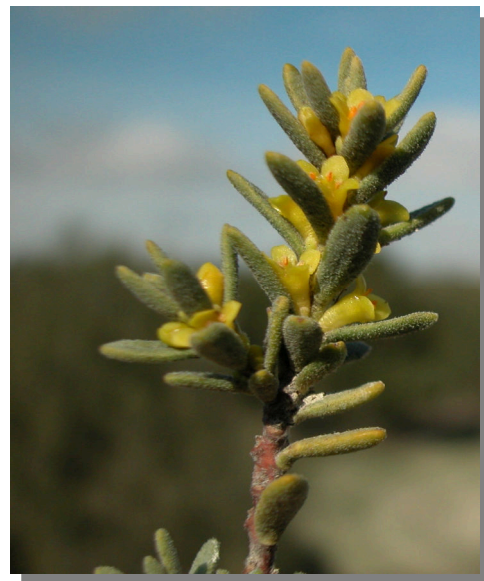
T. tinctoria . Detalle de rama con flores masculinas