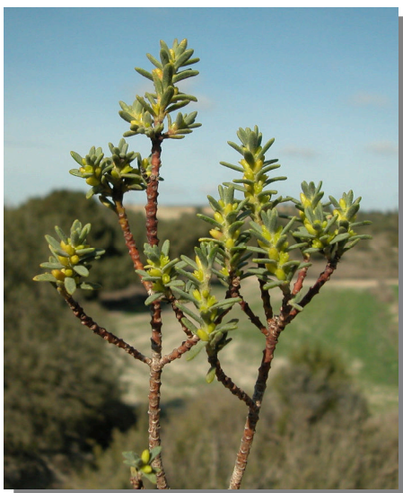
T. tinctoria . Detalle de rama con flores femeninas