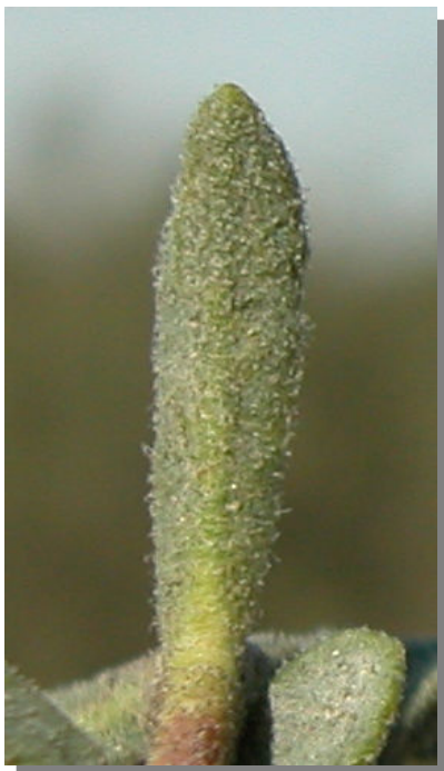
T. tinctoria . Detalle de la hoja: envés