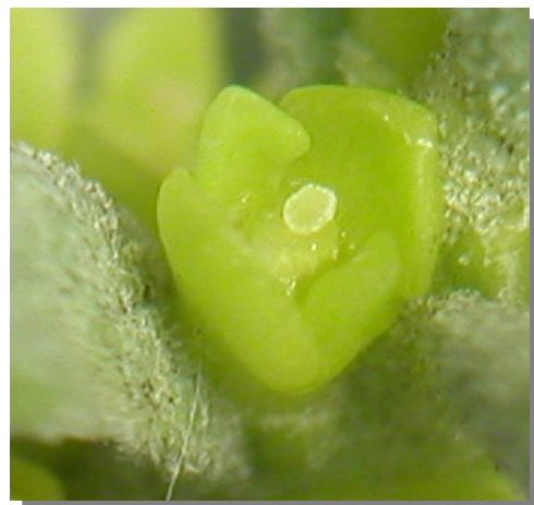
T. tinctoria . Detalle de flor femenina