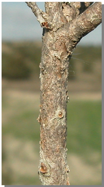
T. tinctoria . Detalle de tallo viejo