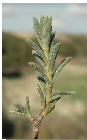
T. tinctoria . Detalle de las hojas

Flores con corola amarilla, unisexuales, sin vellosidad.