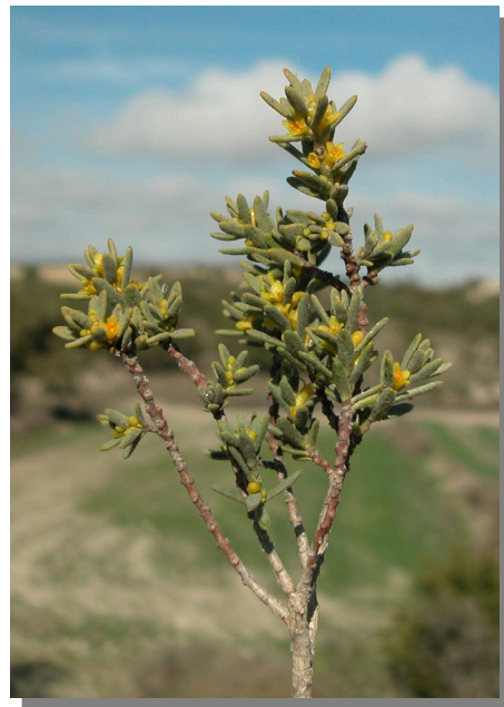
T. tinctoria . Detalle de rama con flores masculinas